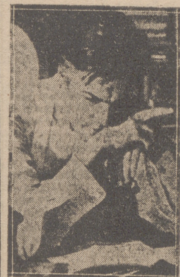
«Carta de una desconocida» es la película que ha hecho famoso en todo el mundo a Louis Jourdan...

que se alzaban entre él y la cuspide han quedado arrolladas. Todo ha quedado vencido gracias al poderoso impulso de su ambiciosa voluntad.