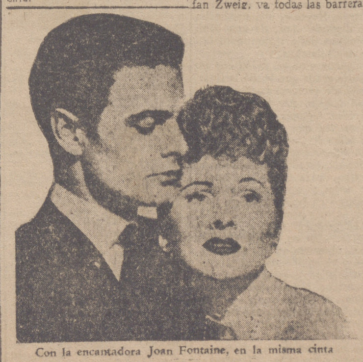
Con la encantadora Joan Fontaine, en la misma cinta