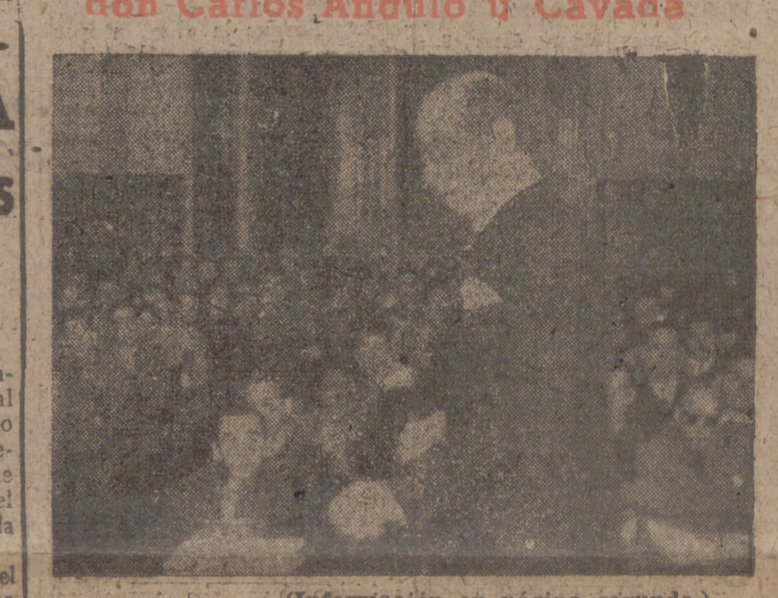
(Información en página segunda.)