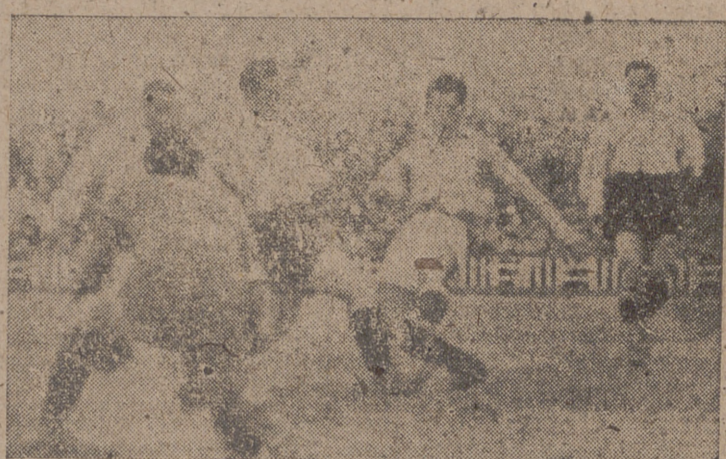
Coque acusa la puerca adversaria, impidiéndole Amorós el remate.

les ha superado siempre las causas primordiales que motivan esta grave situación creada al club y que pone en inminente riesgo de inutilidad el esfuerzo de todo un año, los sacrificios sin cuento de la numerosa y sufrida afición pinciana y el anhelo colectivo de una capital que, con su alcalde al frente, se volcaron en su totalidad para elevar futbolísticamente a Valladolid. Esta es, lisa y llanamente, la verdad, sin paliativos y sin disculpas; porque pasando por alto los pequeños errores que puede haber de otro género y aun reconociendo la falta de unidad y compenetración del equipo, si todos y cada uno de los once componentes del club jugasen con el brío, con el coraje y con la pasión de que nos dan ejemplo todos los equipos que se enfrentan al nuestro, y que el Valladolid suele presentar la mayoría de las veces cuando ya no tiene remedio, sin ningún género de dudas, señores, que esta fase sería una carrera ininterrumpida de triunfos que nos llevarían como supercampeones a la categoría superior.