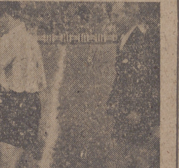
El acupado conjunto del Melilla, que el domingo empató en el Estadio.

Av. Generalísimo Franco, 12 T. 1417 Administración autobuses HENFE Despacho de billetes para las líneas de Madrid, León, Aranda de Duero, Palencia y Salamanca.