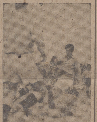
Sánchez se hace apuradamente con la pelota en un momento de apuro para su puerta.

Y si estamos conformes todos en que los jugadores tienen clase y hay medios sobrados en ellos para superar a sus contrarios por juego, ¿por qué no se une el entusiasmo preciso para mejorarlos por coraje, que es un