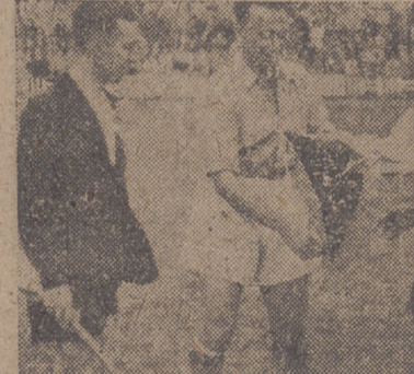
CAMBIO DE BANDERIN ES ANTE ITURRALDE.

Y si estamos conformes todos en que los jugadores tienen clase y hay medios sobrados en ellos para superar a sus contrarios por juego, ¿por qué no se une el entusiasmo preciso para mejorarlos por coraje, que es un