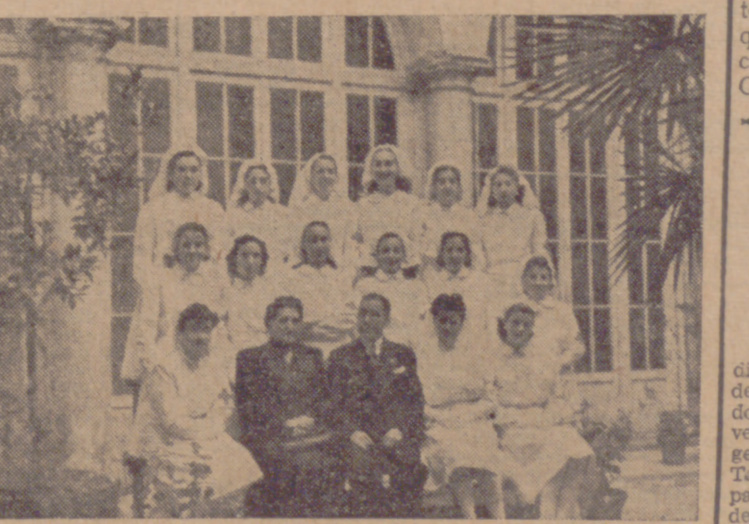
Ayer les fueron entregados los diplomas a las nuevas enfermeras.