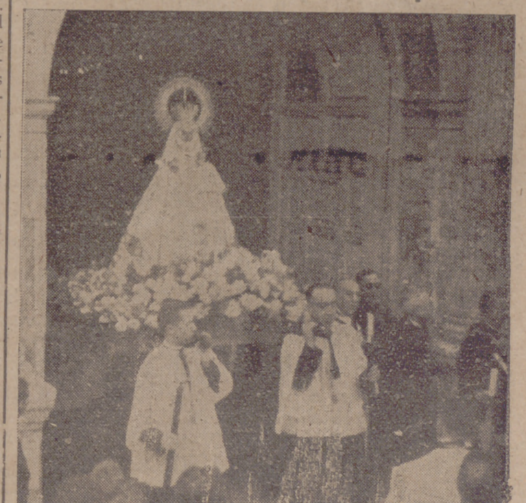
Salida de la Patrona de la parroquia de San Lorenzo.

Ayer, a las ocho de la tarde, se celebró el solemne traslado procesional de la imagen de Nuestra Señora de San Lorenzo, Patrona de Valladolid, desde la iglesia parroquial de su nombre a la S. I. Metropolitana, donde tendrá lugar el solemne novenario que hoy comienza, para terminar en el día de su festividad.