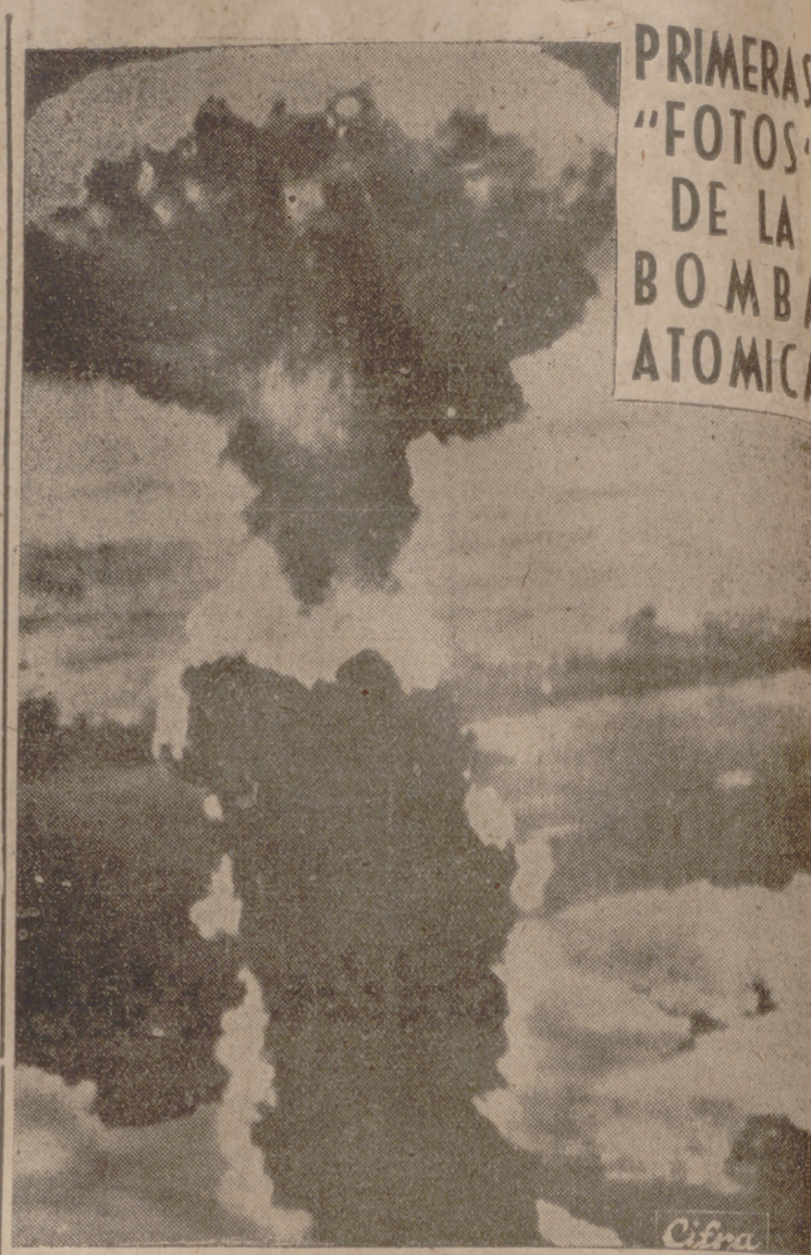
Nagasaki.—La explosión de la bomba atómica. Tres minutos después de ser arrojada la bomba sobre la ciudad, una columna de humo de más de 20.000 pies se eleva sobre la ciudad.

Washington, 30.—La esposa de Chang-Kai Chek, después de haber conferenciado con el presidente Truman, en la Casa Blanca, y con el jefe del Estado Mayor norteamericano, general Marshall, declaró que «muy en breve» regresaría a China. Su conversación con Truman fue breve, pero la que sostuvo con Marshall duró más de una hora. Más tarde estuvo conversando con el jefe del Estado Mayor aéreo, teniente general Ira C. Eaker, y con el jefe de la aviación norteamericana, general H. Arnold.—Efe.