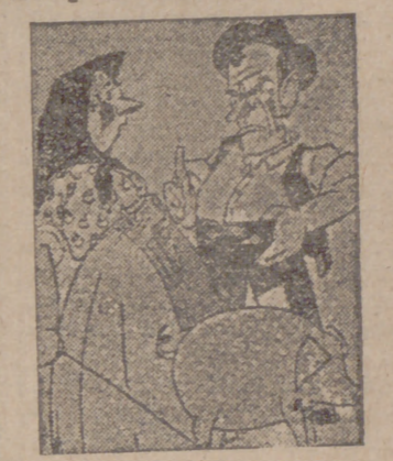
El cerdo.—Esta gente tiene instintos sanguinarios. Están tratando de hacer una matanza.