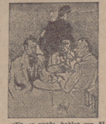
—¡No se puede hablar con Alberto! Siempre está en la oposición: es anti-esto, anti-aquello. —Es... es, sobre todo, antiplástico.