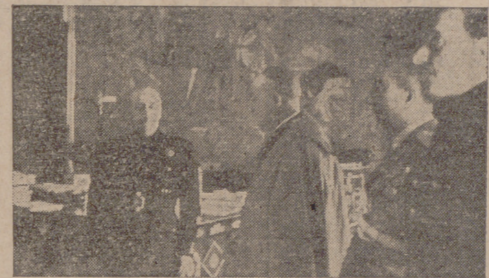
Su Excelencia el jefe del Estado, Generalísimo Franco, recibe en el Palacio de El Pardo el Obispo, autoridades y presidentes de las Compañías malagueñas, que le entregaron una placa con el nombramiento de presidente de honor de la Agrupación de Compañías malagueñas.