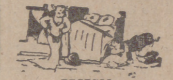
REGRESO —¡Hombre, muy bien! ¡No te contentas con perder la guerra y pierdes también la Havel! (De «Panorama».)