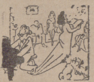
—¿Por qué chillas tanto aquella? —¿No ves que el amo le está pisando la cola?