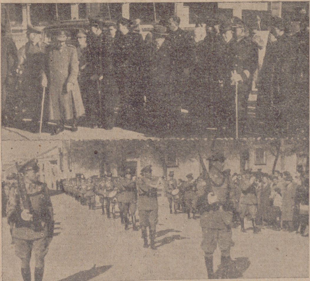
Autoridades asistentes al acto, presenciando el desfile y un momento del mismo.

Con gran brillantez y solemnidad los Cuerpos General de Policía y Policía Armada y de Tráfico honraron ayer a su Santo Patrón, el Santo Angel de la Guarda, en el día de su festividad.