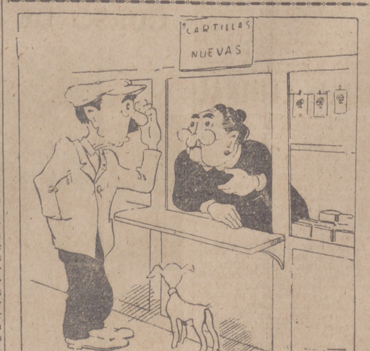
REQUISITOS (Por ITO). —De manera que la cartilla vieja, el impreso, la cédula, el resguardo del racionamiento, el número, la firma... ¡Mi madre, si en vez de ser para una cartilla fuera para un catón!

Stimson anunció también que las bajas totales de los norteamericanos hasta el 21 de febrero, inclusive, son 140.366 muertos, 430.757 heridos, 60.525 prisioneros y 91.037 desaparecidos.—Efe.