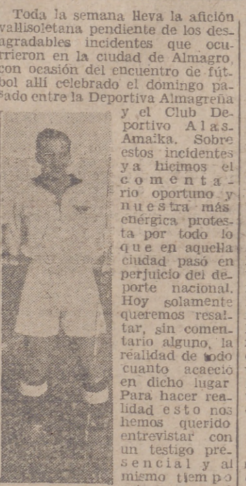
memorable encuentro para la historia de nuestro simpático conjunto del Alas...