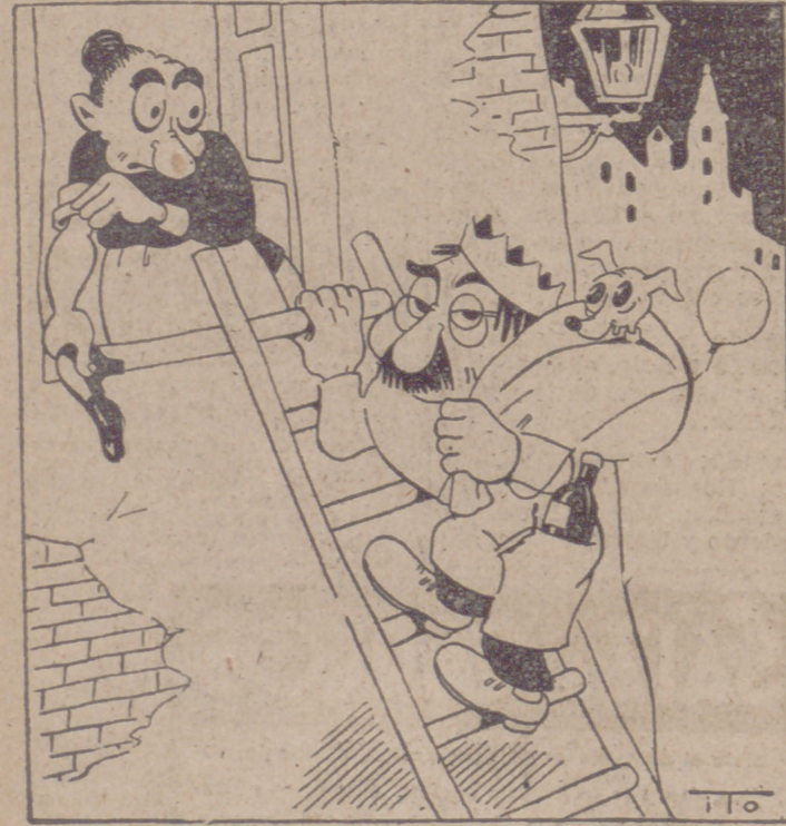
REY IMPOTIOR.— —¡Vaya, este bribón se acuerda este año de mis zapatos!

PROBLEMA Juan y Juanillo, pastores padre e hijo, tenían cada uno su rebaño. Pero éstos eran tan mezquinos, se componían de tan pocas ovejas, que si Juan le daba a Juanillo una, éste tenía la mitad que él; y si Juanillo le daba a Juan una, éste tenía el doble que aquél. ¿Cuántas ovejas tenía cada uno?