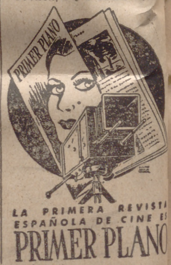
LA PRIMERA REVISTA ESPAÑOLA DE CINE EL PRIMER PLANO