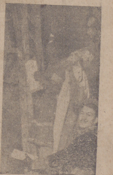
El rey Gaspar, escalando a la Redacción de LIBERTAD, saluda a los niños que esperan su llegada.

blico, que presenció la original subida desde la calle a las Redacciones. La primera visita fué realizada a «El Norte de Castilla» y, sucesivamente, a «LIBERTAD» y «Diario Regional».