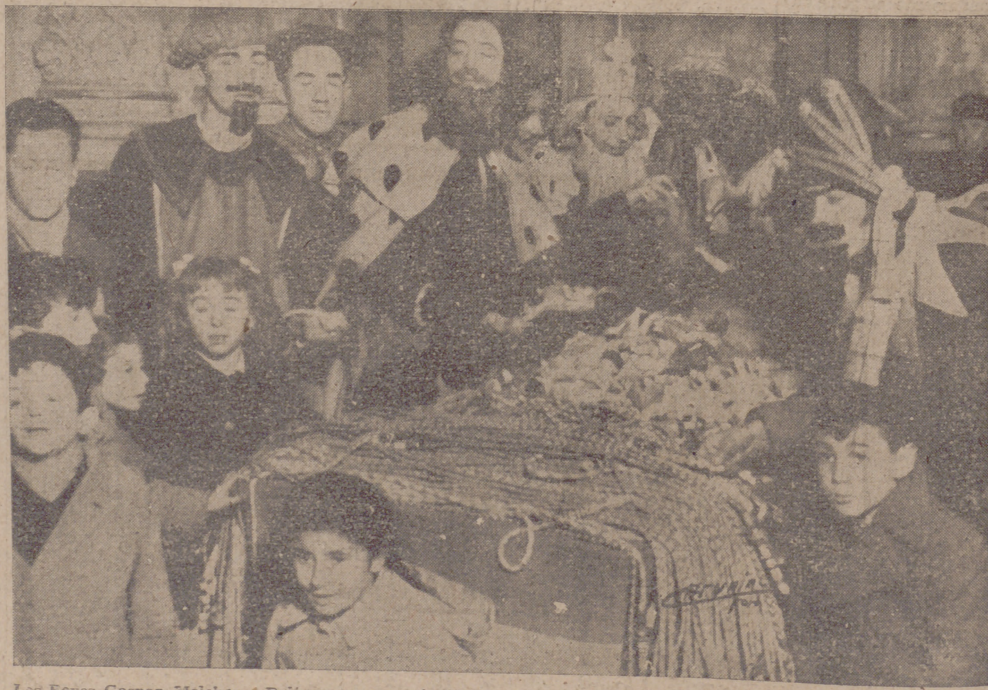
Los Reyes Gaspar, Melchor y Baltasar, con su séquito, repartiendo juguetes durante su visita al Ayuntamiento. A la derecha, el auténtico rey negro.