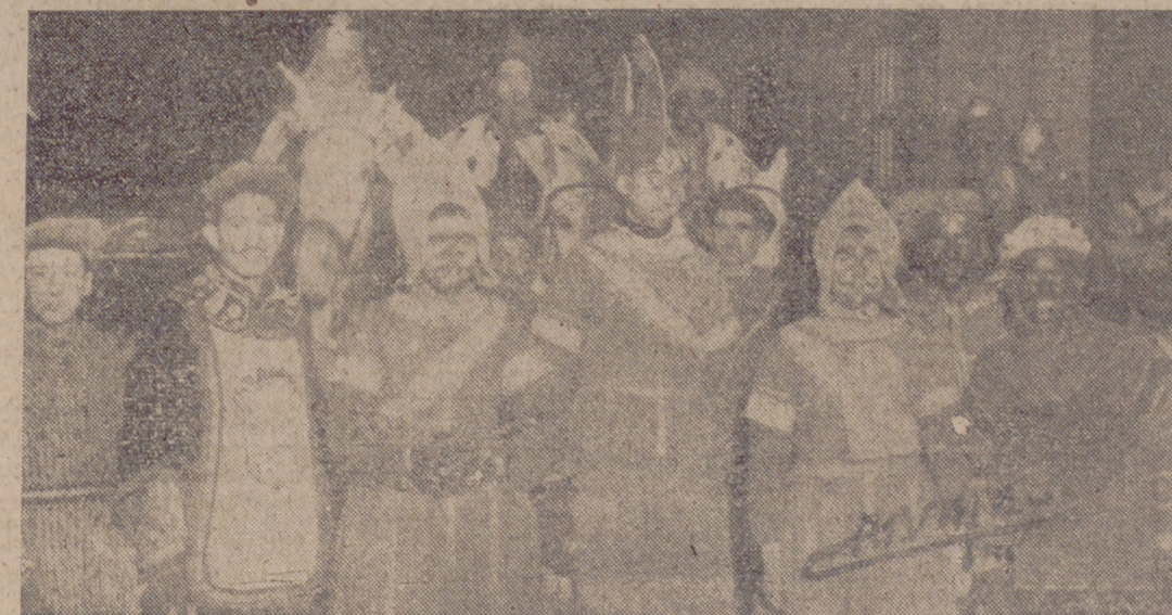
La tradicional cabalgata al iniciar su marcha.

Antes de la hora indicada para ponerse en marcha la comitiva, ya numeroso público había