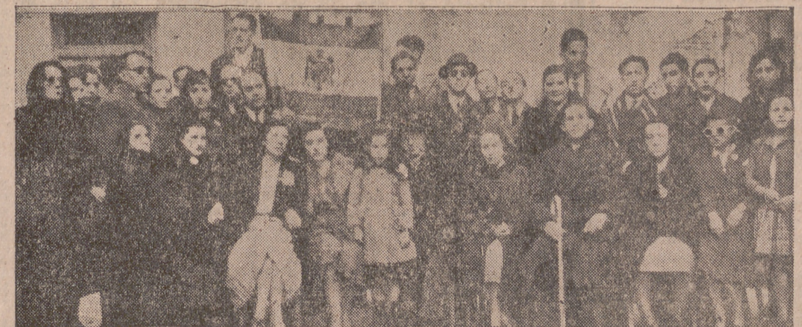
Un grupo de ciegos, pertenecientes a la Organización de Valladolid, que ayer celebraron la fiesta de su Patrona. (Información en la página tercera.)