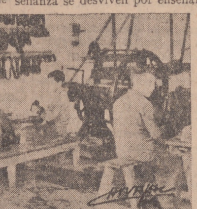
TALLER DE ZAPATERIA.