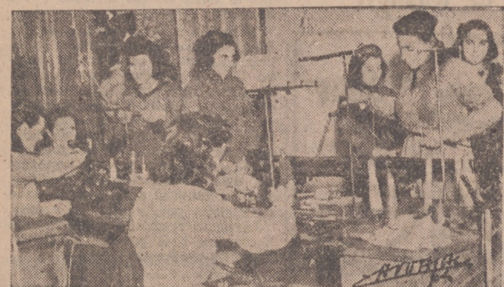
TEJIDOS DE PUNTO (TALLER).