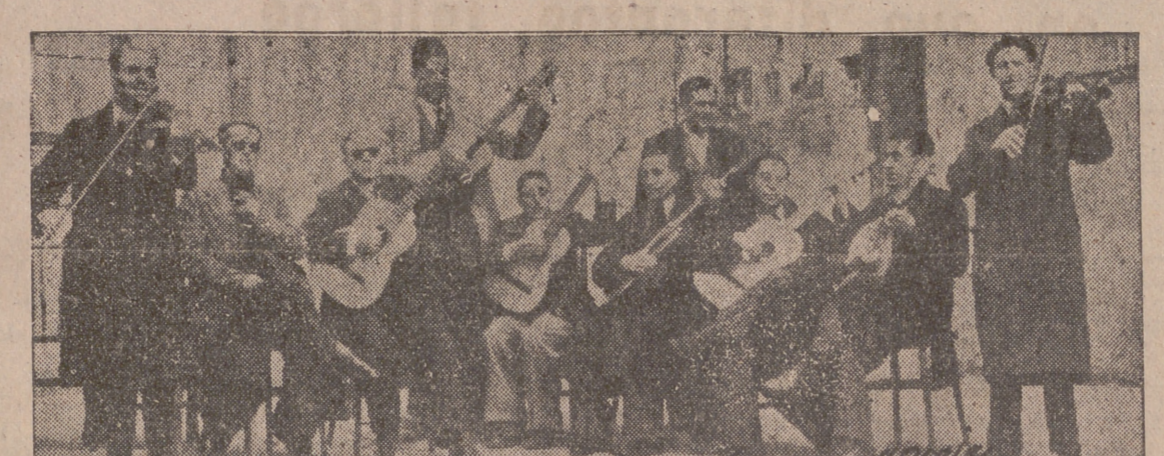
La rondalla de la Delegación de la Organización de Ciegos, integrada por músicos ciegos, ofrece, en el patio del domicilio de la Organización, un concierto a los demás compañeros, con motivo de la festividad de su Patrona, Santa Lucía.