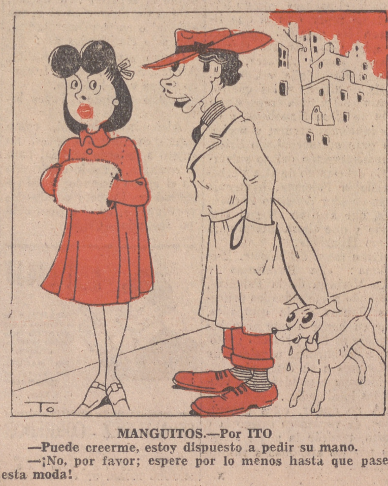
MANGUITOS.—Por ITO —Puede creerme, estoy dispuesto a pedir su mano. —¡No, por favor; espere por lo menos hasta que pase esta moda!

Vertical text on the far right edge of the page, partially cut off.