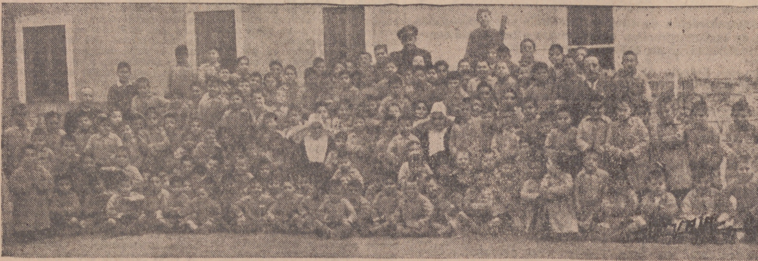
GRUPO DE ACOGIDOS, CON LAS HERMANAS, PROFESORES Y MAESTROS.

Estoy casi seguro que ningún vallisoletano ha ido observando la obra magnífica que se está haciendo dentro del Orfanato Provincial de Valladolid, gracias al espíritu falangista que anima a los actuales gestores de la excelentísima Diputación, cuyo Organismo sostiene este benéfico establecimiento, realizando dentro de él una labor que merece todo el elogio. En el Orfanato Provincial de nuestra ciudad ya se están haciendo realidad los postulados Nacional-sindicalistas en todos los aspectos de la vida del hombre. Aquí es donde es acogido el niño huérfano que no tiene más amparo en esta vida que la Providencia Divina y la caridad de los hombres. El Orfanato Provincial ha pasado por varias fases; algunas de ellas es preferible no reflejar en estas líneas, ya que en los años 1931 al 36 estubo sumido a un completo abandono, causado por quienes estaban obligados a velar por él. La indisciplina reiterada en este establecimiento, aumentando considerablemente, y no lle-