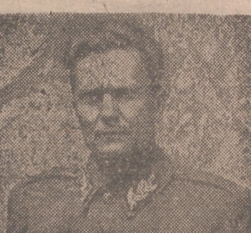
«QUEDA POR DELANTE MUCHO QUE HACER TODAVIA»

Londres, 30.—«Pronto alcanzaremos la victoria sobre nuestro enemigo principal: los alemanes. Pero queda por delante mucho que hacer todavía, no solamente en los campos de batalla, sino más bien en nuestro dolorido y destruido país, que debemos liberar de los numerosos vestigios legados por los alemanes. Todos aquellos que no quieren ver una Yugoslavia democrática y federal, por la cual han muerto cientos de miles de nuestros mejores hombres y mujeres, deberán ser apartados de nuestro camino.» Estas palabras han sido pronunciadas por el mariscal Tito ante la Asamblea Nacional Yugoslava.—Efe.