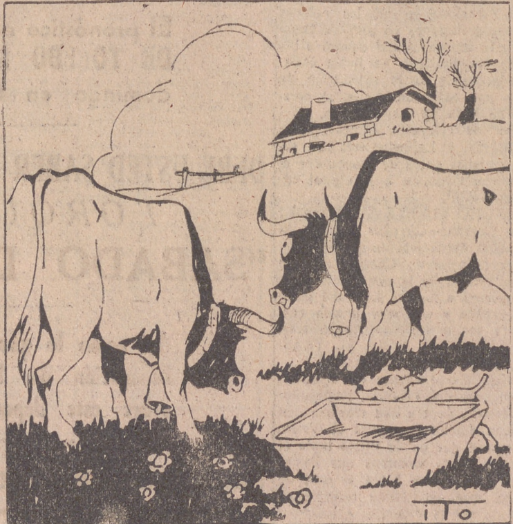
FESTIVAL TAURINO DE LOS VALELLEROS.—Por ITO —Se han llevado tres novillos para el festival. —Pobrecillos, a lo mejor los «despachan» en piezas.

La misma información sugiere que los corresponsales americanos que regresan de Moscú dicen de Stalin que ha envejecido mucho y se ha hecho benevolente y blando, y que le ha da-