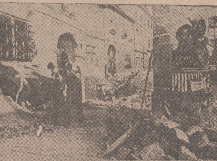
Budapest siente cerca la guerra. La foto ofrece un aspecto de la capital húngara: muestra a la población construyendo refugios.