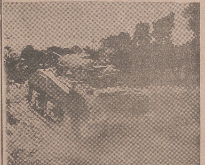
Un tanque británico asaltando posiciones enemigas en el frente franco-alemán.