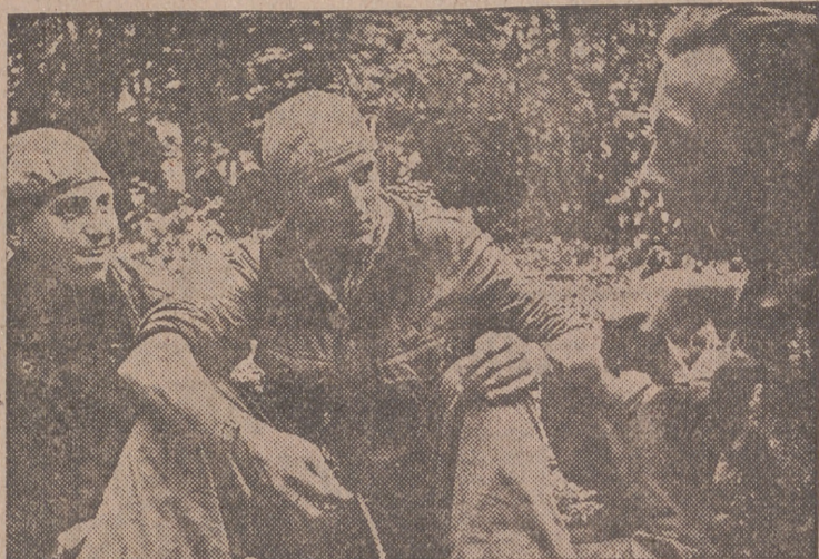
Los éxitos logrados por estos tres hombres, tripulando la nueva arma alemana, han sido: el torpedeamiento de un crucero, el hundimiento de siete mil toneladas y el torpedeamiento de un destructor. Después de sus victorias cambian impresiones.