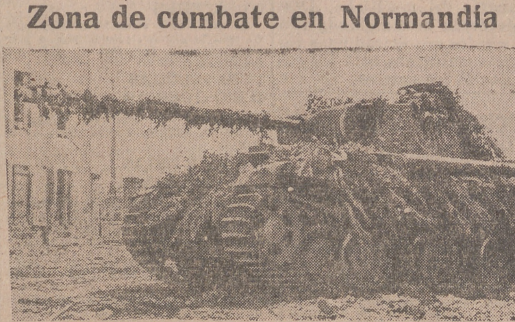
Un «Pantera» alemán ocupa una posición normanda en una calle, entre casas destruidas.

COMUNICADO ALIADO Cuartel General del Cuerpo expedicionario aliado, 3.— El comunicado de hoy dice: «Durante la noche pasada no hubo casi cambios en el frente. Al sudeste de Brecey fué ven-