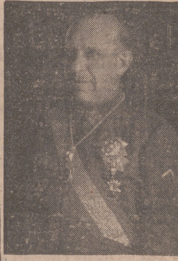
Con la muerte del excelentísimo señor ministro de Asuntos Exteriores, España ha perdido un gran patriota y uno de sus más fervientes servidores. Vinculado desde la primera juventud a labor por la prosperidad nacional, ininterrumpidamente puso sus excelentes dotes a contribución en las variadas actividades para las que una multiplicidad de aptitudes le permitía. Jalonados están los principales pasajes de su vida militar de señalados servicios prestados a la Patria, y todos sus ascensos puede decirse que estuvieron precedidos de extraordinarias manifestaciones con que en el campo del honor, batiéndose por España, accedió a elevados puestos. Su mismo título nobiliario tenía origen en las tierras de Africa, donde continuó escribiendo las apretadas columnas de su historia militar, comenzada en la guerra de Cuba. Sufrió vejaciones de la República por no doblegarse a ella ni acomodarse a los nuevos modos con los que distaba sustancialmente su hombria. Colaboró en los hechos gloriosos que dieron por resultado la solución del problema marroquí en tiempos de la Dictadura. Prestó, asimismo, especialísimas colaboraciones desde el primer momento de la Cruzada al Caudillo, y últimamente rigió el Departamento de Asuntos Exteriores con cierto criterio y a satisfacción en difíciles y delicados momentos.

Asuntos Exteriores, conde de Jordana, a consecuencia de una hemorragia interna, seguida de asistolia, muriendo rápidamente a causa de un colapso. El fallecimiento ocurrió a las 13,40 de la tarde. Inmediatamente después se dió conocimiento del hecho a todas las autoridades, personalidades y diplomáticos que se encuentran en San Sebastián. Se colocaron pliegos, que fueron llenándose con gran rapidez. Uno de los primeros pésames recibidos fué el del ministro secretario general del Movimiento, que lo hizo en su nombre y en el de Falange Española Tradicionalista y de las J. O. N. S.—Cifra.