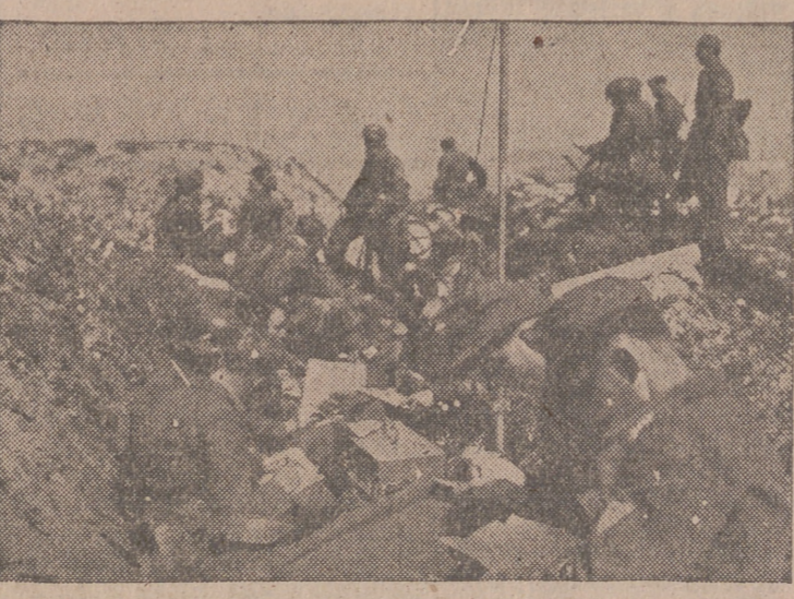
Grupos de paracaidistas aterrizan en los campos donde muestran actividad los guerrilleros, para combatirlos eficazmente. Esta efotom nos muestra la transmisión de noticias de un grupo al Alto Mando, por medio de una emisora rápidamente instalada.