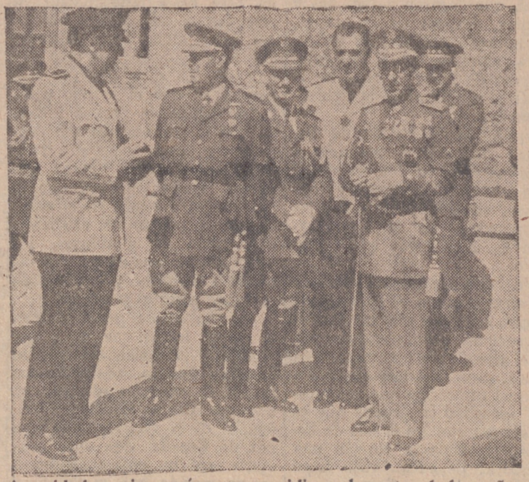
Autoridades y jerarquías que presidieron los actos de la mañana

Con motivo de la festividad de Santiago Apóstol, Patrón del Arma de Caballería, se celebraron en el día de ayer varios actos, entre ellos una misa solemne en la iglesia de San Benito el Real, a la cual asistieron, el director de la Academia de Caballería, profesores y oficiales cadetes del Arma, así como un escuadrón del Regimiento de Farnesio con sus respectivos jefes y el coronel del mismo. Una vez terminada la santa misa, en la cual dirigió una elocuente plática a los asistentes el capellán de la Academia, desfilaron ante las autoridades militares y civiles los oficiales cadetes y el mencionado escuadrón de Caballería a pie.