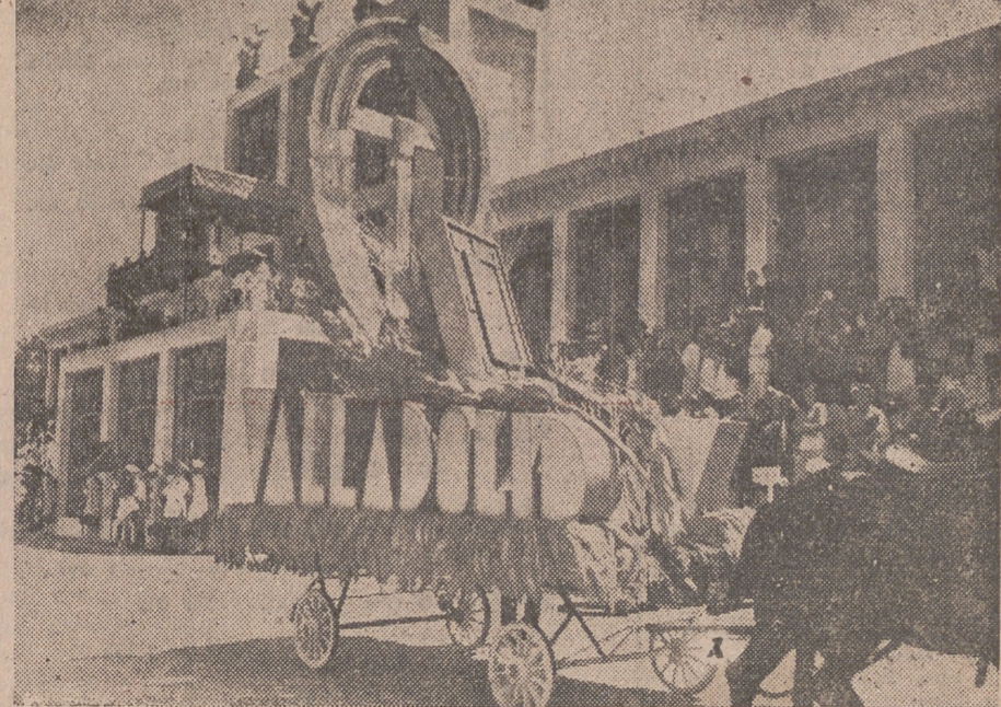
La carroza de Valladolid en la comitiva de alegorías del trabajo.