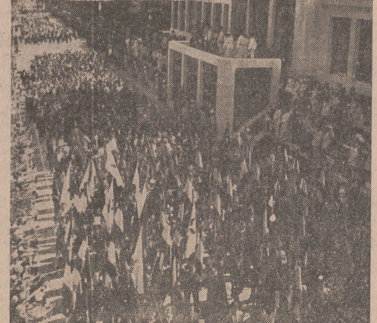
Desfile de productores ante el Caudillo.