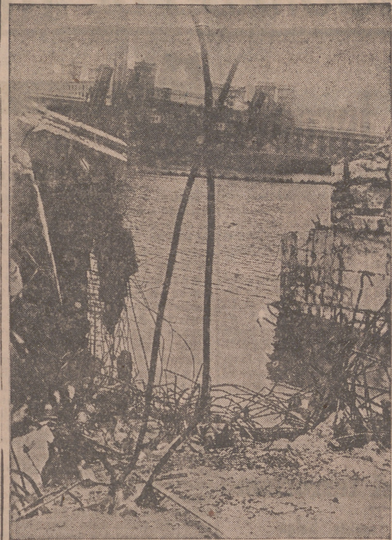
Antes de rendirse los últimos defensores fueron cuidadosamente voladas con dinamita todas las instalaciones portuarias de interés.

Cuartel General avanzado en Nueva Guinea, 19.—El Cuartel General aliado comunica: «Se registran impactos conseguidos por la aviación en buques japoneses. En el puerto de Maomere de la isla de Flores y hacia el oeste hasta la isla Soemban, los bombarderos pesados hundieron o averiaron dos buques, cada uno de 1.000 toneladas, y en la región de Halimahara, a consecuencia del ataque con bombas y ametralladoras, un transporte de 3.000 toneladas fué abandonado ardiendo e inmóvil. En el Golfo de Maclower, en Nueva Guinea holandesa, bombarderos medios hundieron un barco mercante de 1.000 toneladas, un buque costero y varias pequeñas embarcaciones.—Efe.