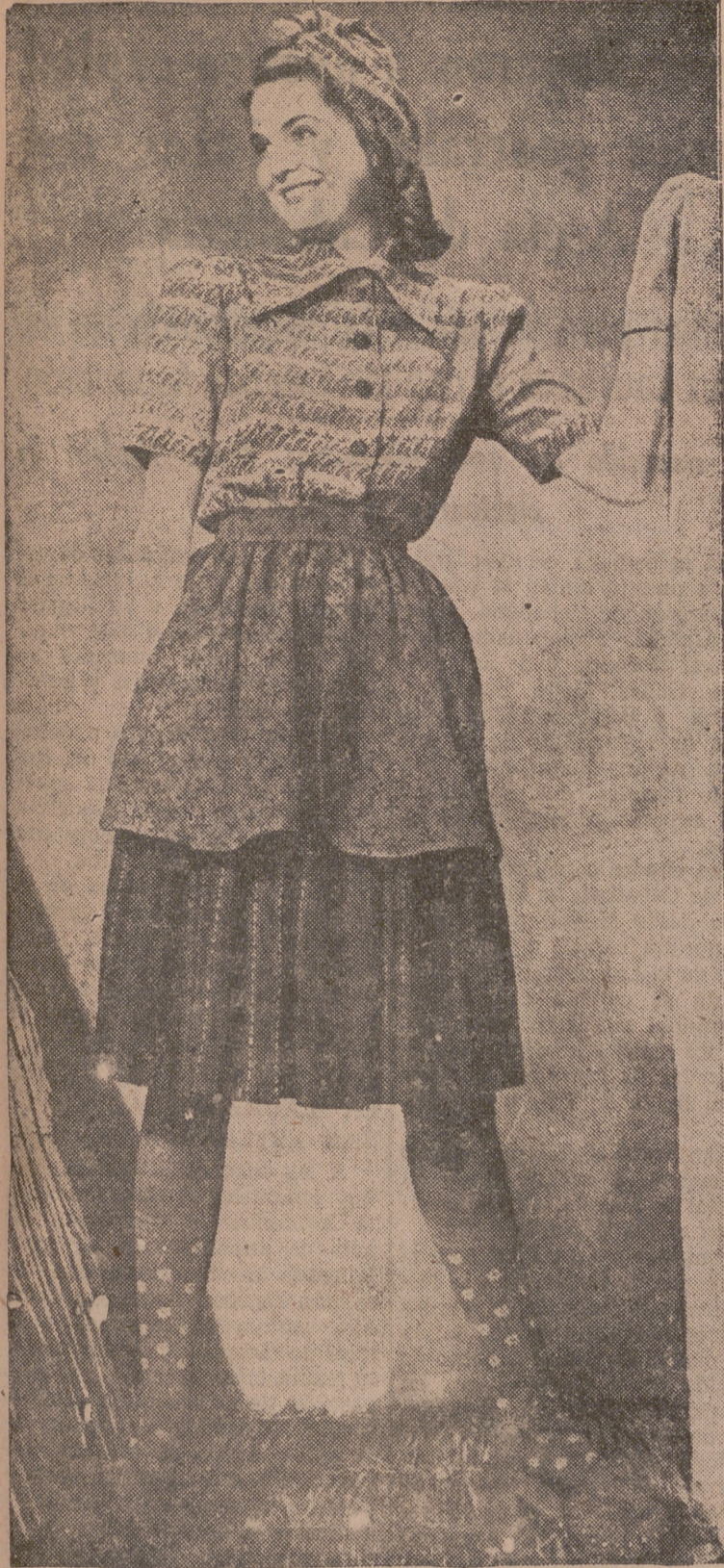
La falda es de fondo marrón y el dibujo de las tiras en verde y amarillo. La blusa a marilla, estampado en marrón y rojo; el delantalillo en marrón y verde.