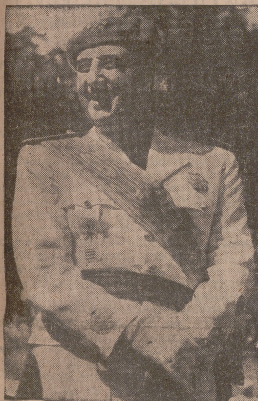
Texto del discurso pronunciado por el Caudillo ante la Sección Femenina en El Escorial:

“Virtud de nuestro Movimiento es levantar y convertir en vivo lo que se encuentra como dormido o muerto”