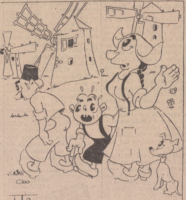
EN HOLANDA. — Por ITO —Mira que eres, Atanasio; ves cómo está llorando el niño y no le compras un molinillo

Aquí no es la resistencia de meras fuerzas de retaguardia las que encuentran hoy los angloamericanos, sino la oposición de divisiones enteras—por lo menos el 80 por 100 de los efectivos de Kesselring son empleados en las acciones en curso—que se aferran con tenacidad a todos los accidentes del terreno para sostener a toda costa en su línea de contención del sur de Livorno. Por eso también hoy puede asegurarse que no serán las dos o tres jornadas próximas las que registren una nueva evolución de la campaña de Italia, que no será decidida, en esta antepenúltima fase, por la pérdida o conquista de localidades de más o menos importancia, sino por el grado de desgaste que pueda ocasionarse al enemigo sin el debilitamiento propio. Esta es la vieja táctica de Alexan-