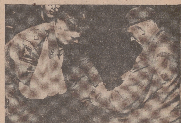
Un aviador británico herido al intentar tomar tierra en la costa norte de Francia es atendido por sanitarios alemanes antes de ser conducido a un campo de concentración.