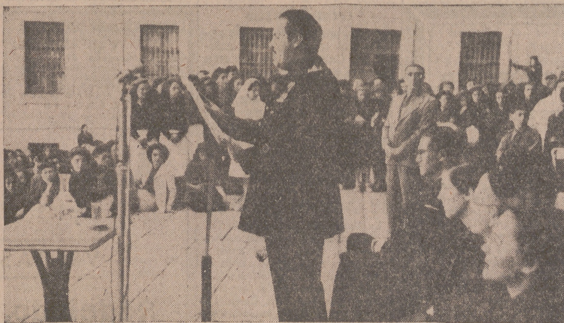
El ministro de Trabajo, camarada Girón, durante su discurso en la II Concentración Nacional de la Sección Femenina en El Escorial.