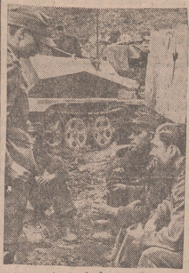
Después de haber rechazado un duro ataque de las fuerzas aliadas en Normandía, los granaderos antitanques alemanes descansan entre sus vehículos.