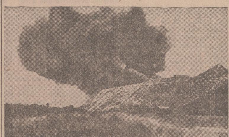
En los recientes desembarcos aliados en ningún sector fué sorprendida la defensa costera alemana, como lo demuestra la fotografía.