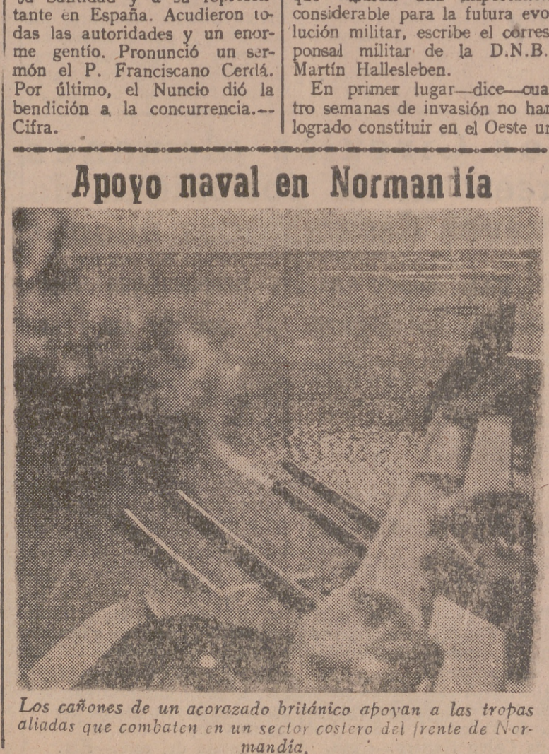
Los cañones de un acorazado británico apoyan a las tropas aliadas que combaten en un sector costero del frente de Normandía.