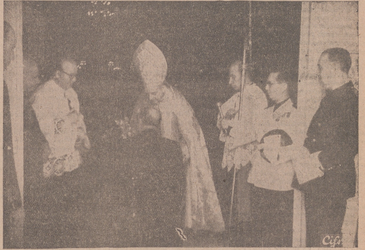
Madrid.—El Obispo de Madrid-Alcalá impone la medalla de la Cofradía de San Isidro Labrador a S. E. el Jefe del Estado, Generalísimo Franco, Hermano Mayor de la misma.