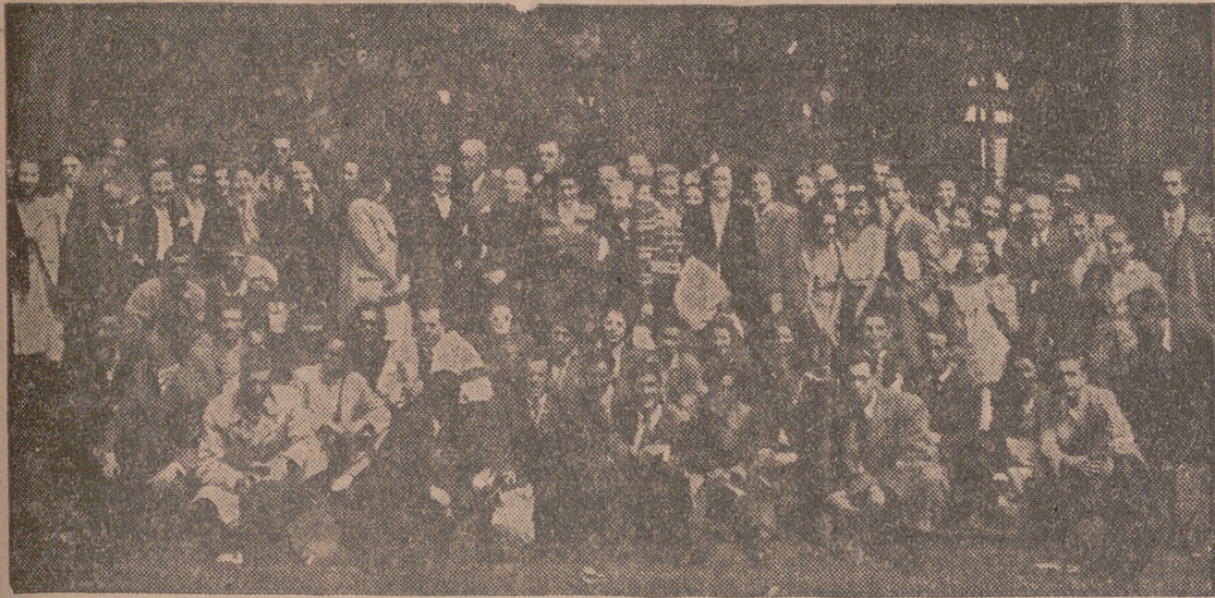
La Coral de La Coruña, a su llegada a Valladolid, recibida por el alcalde y otras personalidades.

Ayer visitó nuestra ciudad la Coral Polifónica de La Coruña "El Eco", que en la actualidad hace un recorrido por varias provincias hasta llegar a Madrid.