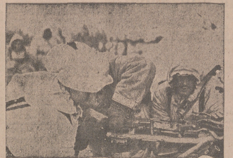
Solamente algunos segundos necesitan los soldados alemanes para realizar la operación tantas veces repetida.