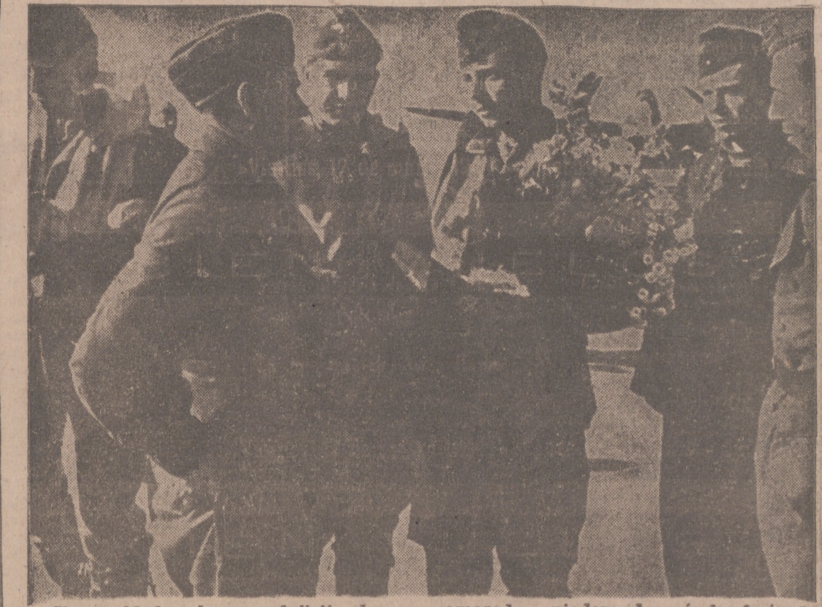
Unos soldados alemanes felicitando a sus camaradas aviadores después de efectuar cien vuelos contra el enemigo.—(Orbis-Foto).

Fuerzas de protección de la Marina de guerra hundieron anoche, en experimentes pérdidas, cuatro lanchas rápidas inglesas en un nuevo combate naval librado en el Canal de la Mancha.—Efe.