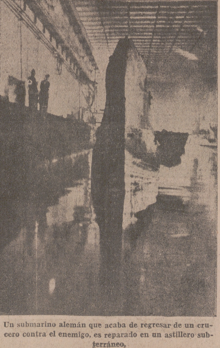
Un submarino alemán que acaba de regresar de un crucero contra el enemigo, es reparado en un astillero subterráneo.