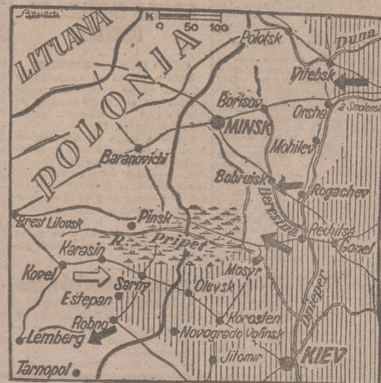
Zona del frente ruso donde la lucha es muy violenta

Madrid, 29.—El cadáver del Obispo de Urbamba ha sido depositado en la capilla ardiente instalada en el convento de Dominicos del Olivar, y durante toda la mañana se han rezado misas. Ha comenzado el desfile de personalidades por la capilla ardiente, entre las que figuran el ministro de Educación Nacional, señor Ibáñez Martín; el marqués de Aunós, en representación del ministro de Asuntos Exteriores, conde de Jordana; el embajador del Perú, el Obispo de Salamanca y el Nuncio de su Santidad; miembros del Consejo de la Hispanidad y otras autoridades y jerarquías