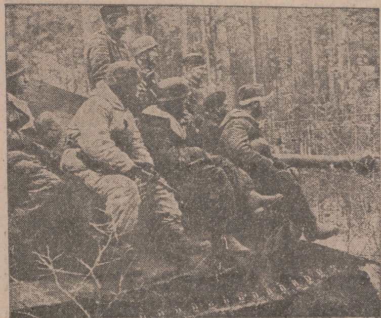
Aun en medio de la seva enemiga, llega el momento de descanso a la tripulación de este "Tigre" alemán.