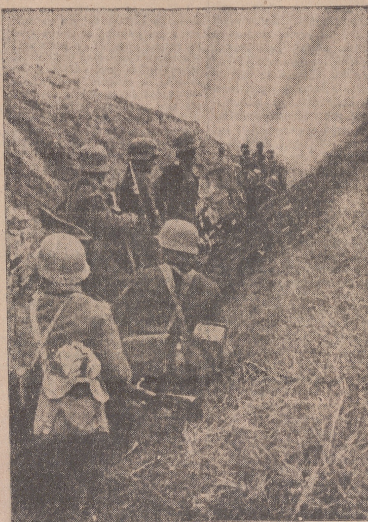
Una sección de la caballería rumana, que incidentalmente actúa como infantería, espera la orden de ataque. Los rumanos llevan cascos alemanes para no ser confundidos por la artillería con los bolcheviques, cuyos cascos son muy parecidos a los rumanos.