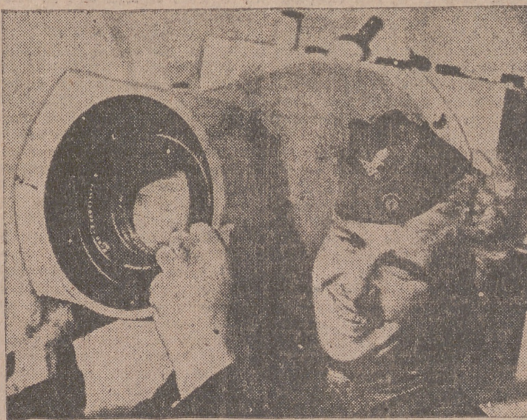
El fotógrafo de a bordo coloca en el avión el novísimo aparato que facilitará la obtención de material gráfico durante el vuelo