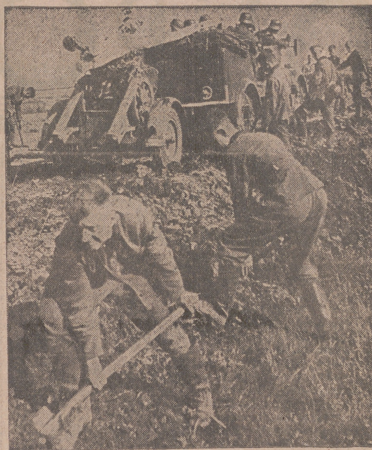
Soldados alemanes haciendo hueco en el suelo para emplazar una pieza antitanque.