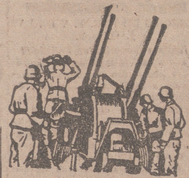
No han regresado de todas estas operaciones tres de nuestros aparatos.

Los huelguistas han volado con dinamita cuatro puentes ferroviarios, entre ellos el mayor del país sobre el río