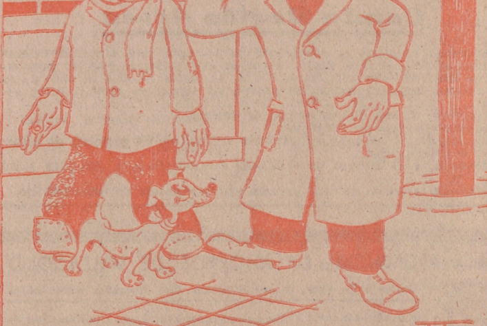
SORDERA, por ITO —¿Pero no sabe usted cuánto van a dar el tabaco...? —¿Eh...? ¡No se oye nada!!

Si el Ejército polaco fue entonces el dique protector de Europa, cómo no ha de serlo hoy el Ejército alemán? Porque si era grande el peligro en 1920 es inmenso el de ahora, ya que sólo queda una potencia en Europa capaz de medirle con Rusia en el Continente. Desoir en estos momentos la voz de la razón, más que ingenuo y pueril es suicida.