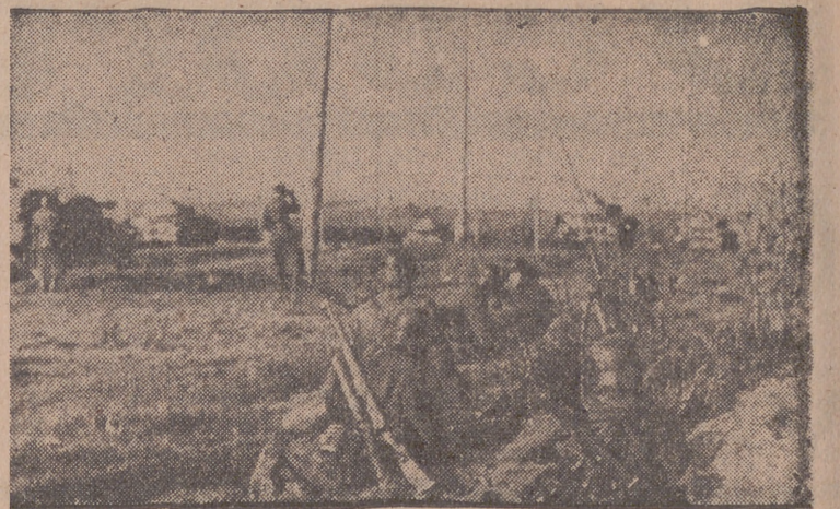
Granaderos alemanes, al borde de una carretera, esperan la orden de ataque a un bosque cercano ocupado por el enemigo.