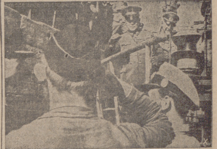
En su visita a la costa atlántica, el teniente general Oshima tiene ocasión de saludar a unos submarinistas alemanes que regresan de una acción contra el enemigo