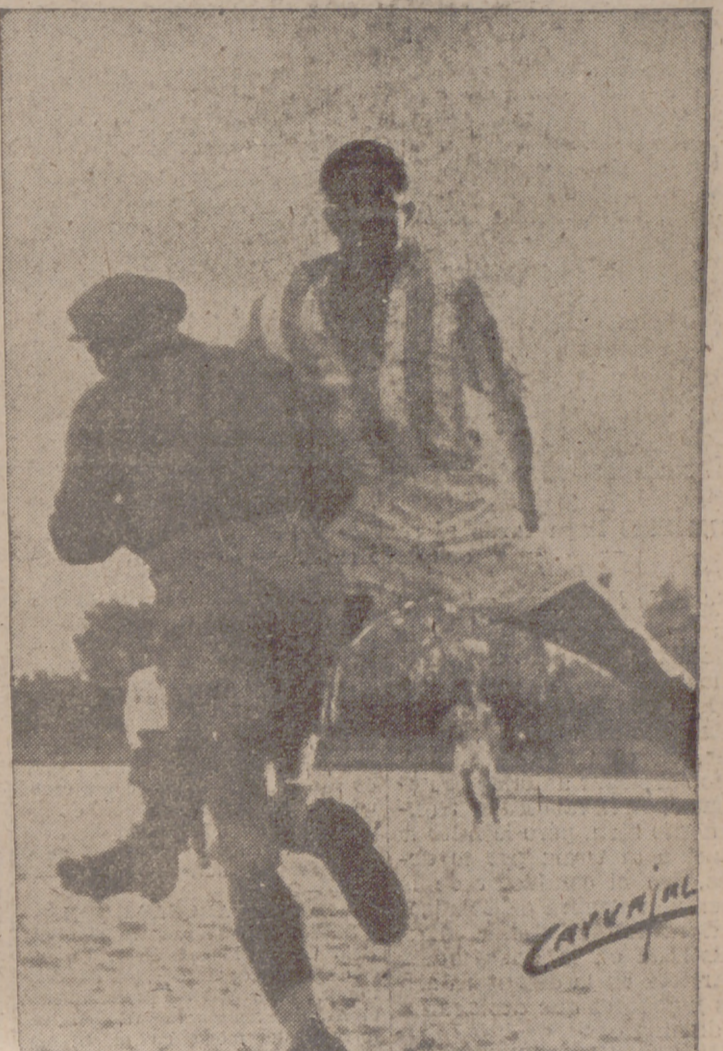
El portero zaragozano se hace con el balón, acosado por Quetglas.

Pero... ya está aquí la línea delantera. Fracasó el domingo en sus extremos, poco veloces y un sí es no es precavi-