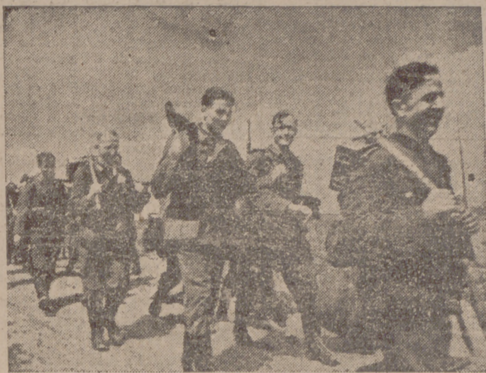
Zapadores y granaderos germanos dirigiéndose a las líneas avanzadas de combate.

La señora de Roosevelt habla sobre las pérdidas rusas y yanquis