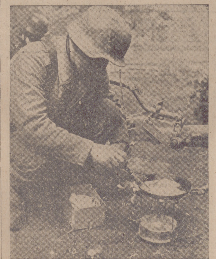
Este soldado alemán aprovecha un compás de espera en la lucha para hacer una tortilla.