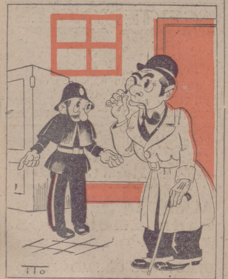
POLICIA, por ITO —Se ve que el asesino estaba metido en la nevera antes de cometer el crimen. —Ah claro claro... ¡¡Ya decía yo que era un individuo con mucha sangre fría...!!