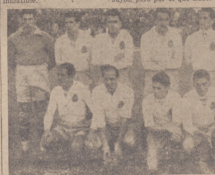
El «once» del Zaragoza que el domingo empató con el Real Valladolid.

Esto es el Zaragoza, y en Soladrero y sus alas radica su fortaleza. Buen equipo para la defensa, pero poco hecho para ganar encuentros marcando goles.