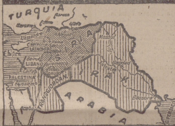
Con una cruz señalamos en la costa mediterránea oriental el emplazamiento del Líbano. En el mapa dibujamos Siria, Palestina, Irak y Arabia, países que encierran preocupaciones para el porvenir.