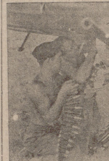
Los soldados de un aeropuerto alemán cargan con nueva munición las ametralladoras de un «Me-109»