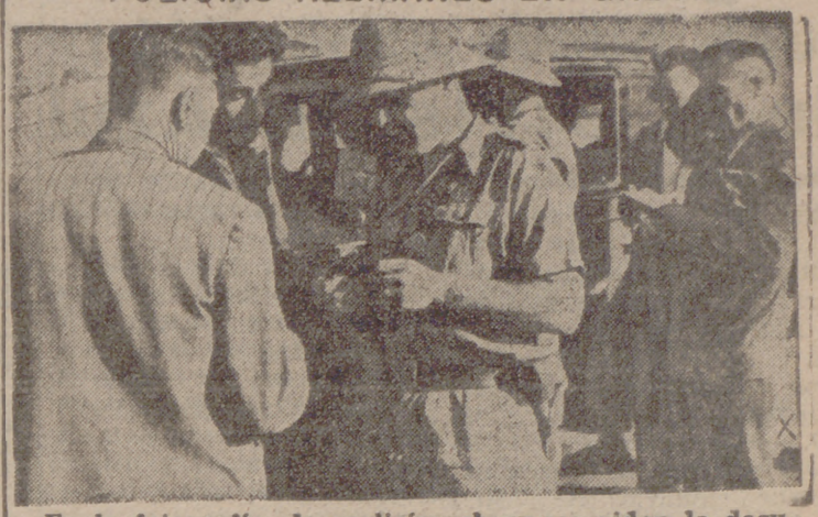
En la fotografía, dos policías alemanes piden la documentación a unos automovilistas en una carretera griega