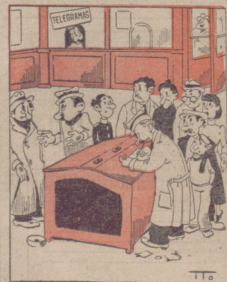
PARA CASOS DE URGENCIA... LLEVE CADA UNO LA SUYA!