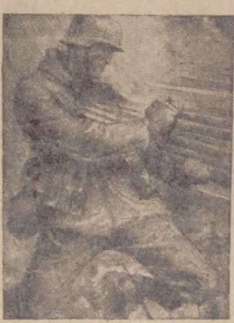
do especialmente por su excepcional bravura en un eficaz contraataque.

En el curso de los vanos ataques soviéticos contra los accesos septentrionales de la península de Crimea han sido destruidos nuevamente varios tanques enemigos. Una compañía de carros blindados rumanos se ha distinguido especialmente por su excepcional bravura en un eficaz contraataque.