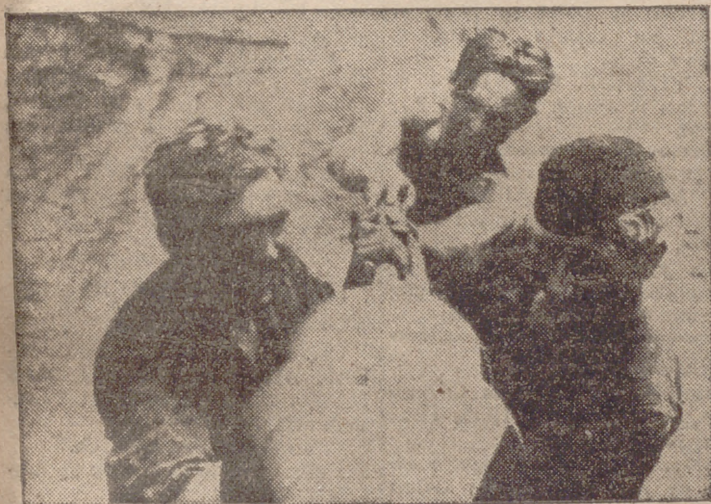
Para la limpieza del largo cañón del tanque «Tigre» alemán son necesarios tres hombres