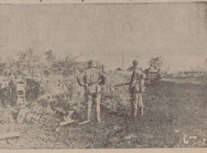
Tras la dura batalla de tanques, los infantes preparan el ataque.