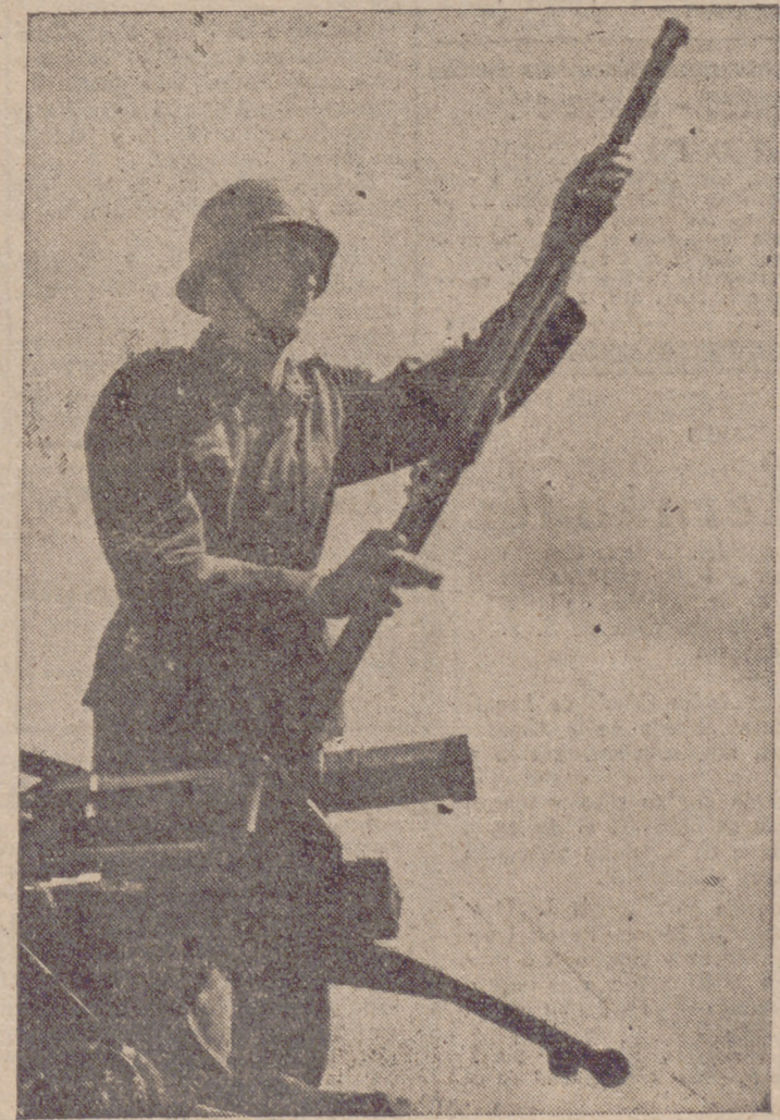
Un soldado alemán de la D. C. A. disponiéndose al ataque