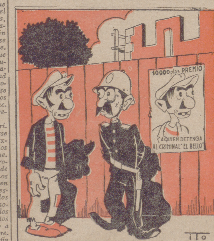
«DESPISTE», por ITO (El guardia): Su cara no me es desconocida... ¡¡A mí me parece que le he visto a usted en alguna parte...!!!

El lunes próximo se dará una fiesta oficial en la que tomarán parte los grupos vencedores de las pruebas, y el martes se repetirá esta fiesta a precios populares. Para esta última representación las localidades pueden adquirirse en la taquilla del citado teatro desde el domingo por la tarde.