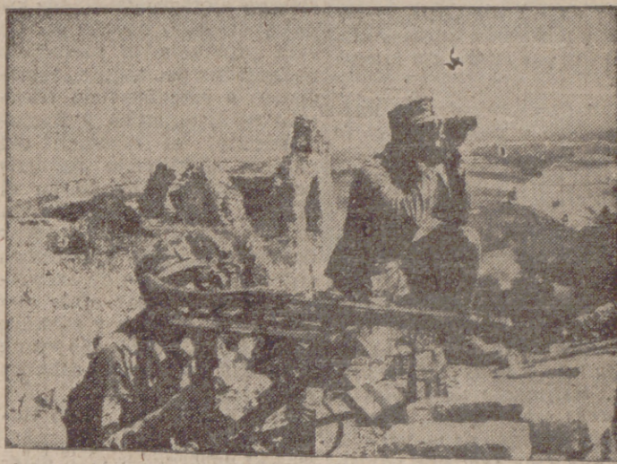
Puesto de observación elevado alemán en el sector central del frente del Este