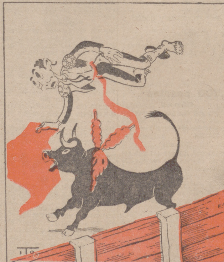
A CADA UNO LO SUYO, por ITO (El toro).—¡Mi padre! A este tío van a tener que multarle por falta de peso.

San Sebastián, 13.—Por la frontera de Irún ha llegado una expedición de voluntarios de la gloriosa División Azul, heridos o enfermos, aunque todos convalecientes. En la ciudad fronteriza fueron objeto de un carinosísimo recibimiento por parte de las autoridades militares, civiles y jerarquías del Movimiento y el pueblo en general, que les vitoreó con entusiasmo. Las camaradas de la Sección Femenina de Falange Española Tradicionalista y de las J. O. N-S. obsequiaron a los combatientes con tabaco y licores. Los expedicionarios continuaron su viaje a San Sebastián, donde han quedado hospitalizados doce, y los restantes lo serán en Vitoria y Burgos.—Cifra.