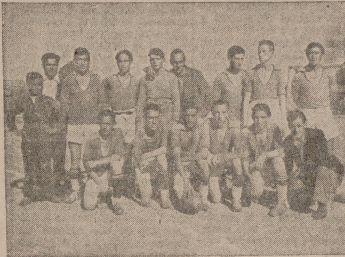
Equipo de la Pílarica