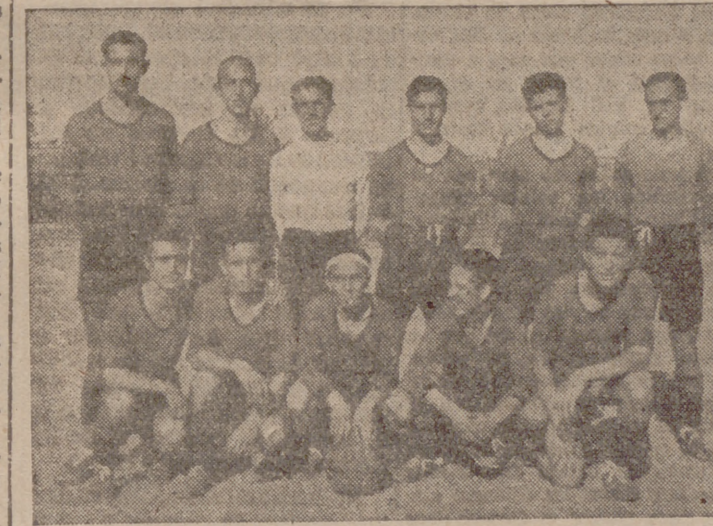
El «once» de la J. O. C. que el domingo se enfrentará con el equipo de la Pílarica