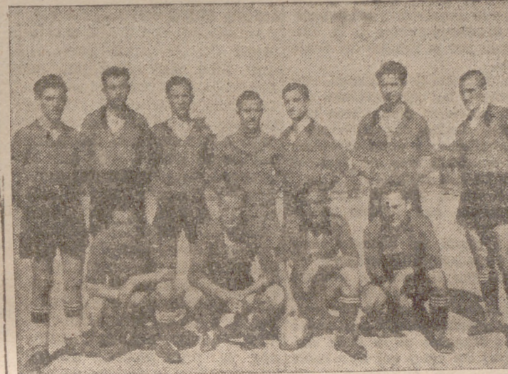
El Delicias, que fué vencido por el Cultural-Pisuerga