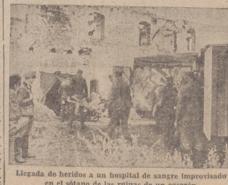
Llegada de heridos a un hospital de sangre improvisado en el sótano de las ruinas de un caserón