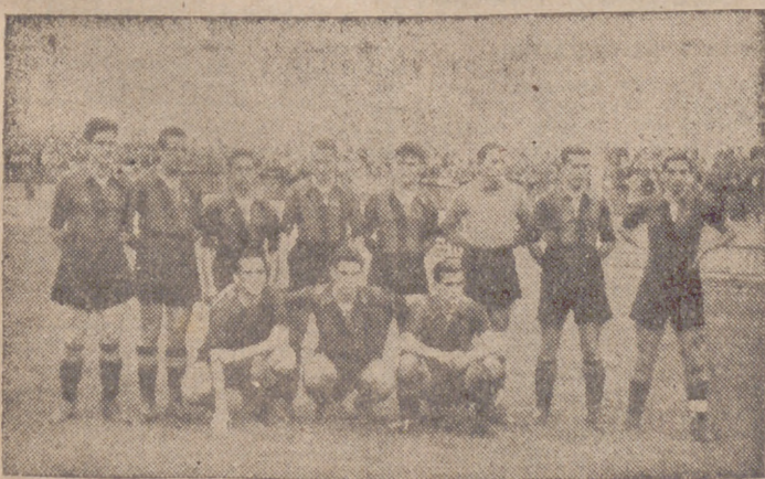
EL «ONCE» DEL ARENAS