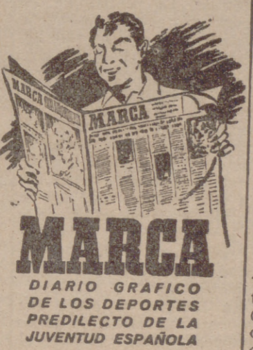
Administración: Carretas, 10. Madrid.

Copenhague, 4.—Ha sido descubierta una vivienda construida hace 2.000 años cerca de Assum, en la isla de Fionia. Los trabajos de excavación han puesto a la luz del día un trozo de techo de siete metros por cinco y restos de cacharros de barro.—Efe.