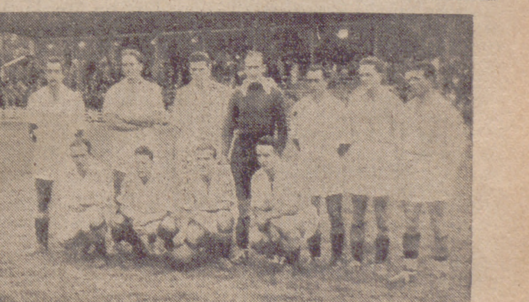
EQUIPO DEL VALLADOLID