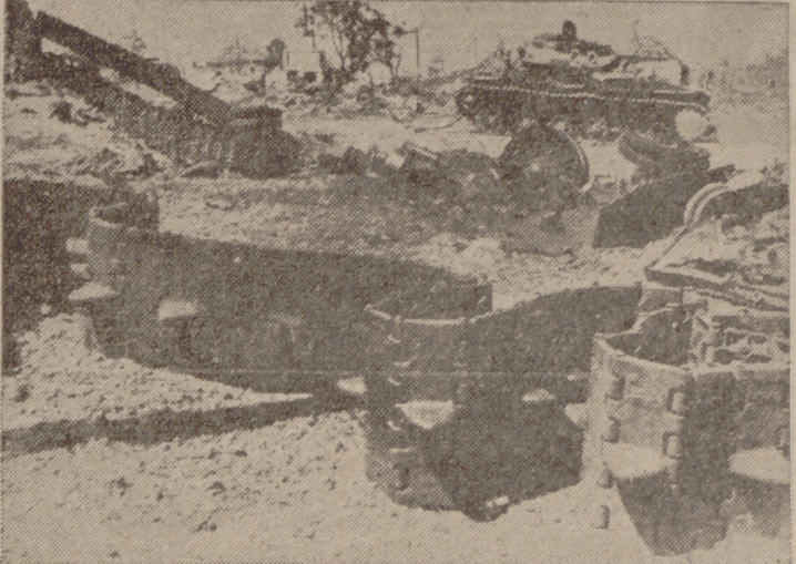
Restos de tanques soviéticos destruidos en las grandes batallas de los últimos días