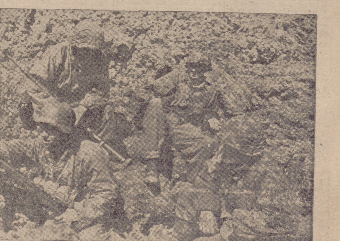
Aprovechando una hondonada formada por una bomba, estos granaderos alemanes descansan unos momentos en la dura lucha