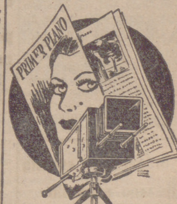
LA PRIMERA REVISTA ESPAÑOLA DE CINE ES PRIMER PLANO