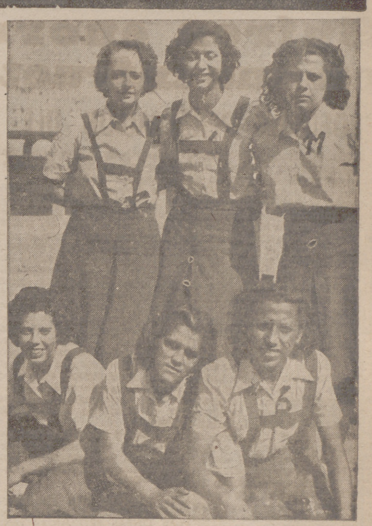
El equipo de Asturias jugó bien. Sin llegar a hacer un gran encuentro se amoldó a las circunstancias del partido, practicando el juego requerido, prueba de una magnífica dirección. Digno contrario de este equipo fue el conjunto madrileño, que, sin llegar a obtener la victoria, opuso en todo momento gran resistencia, acreditando la fama de que venía precedido...