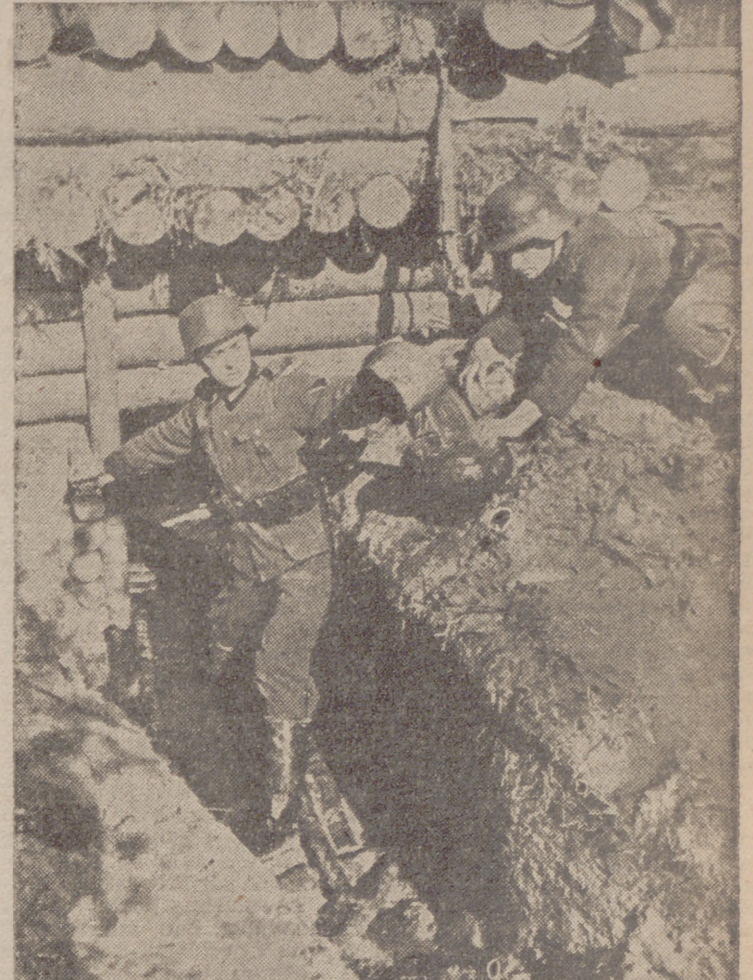
El deshielo en los frentes del Este. Estos soldados alemanes tienen otro enemigo que vencer: es el agua que inunda sus trincheras impidiéndoles la vida en ellas. Aquí vemos a unos soldados sacando el agua con cubos.