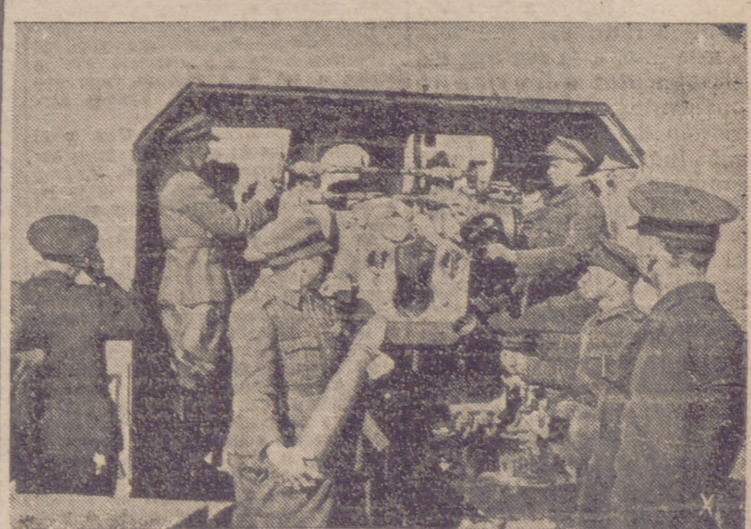
Uno de los cañones de costa empazados por los rumanos, en el momento de disparar.