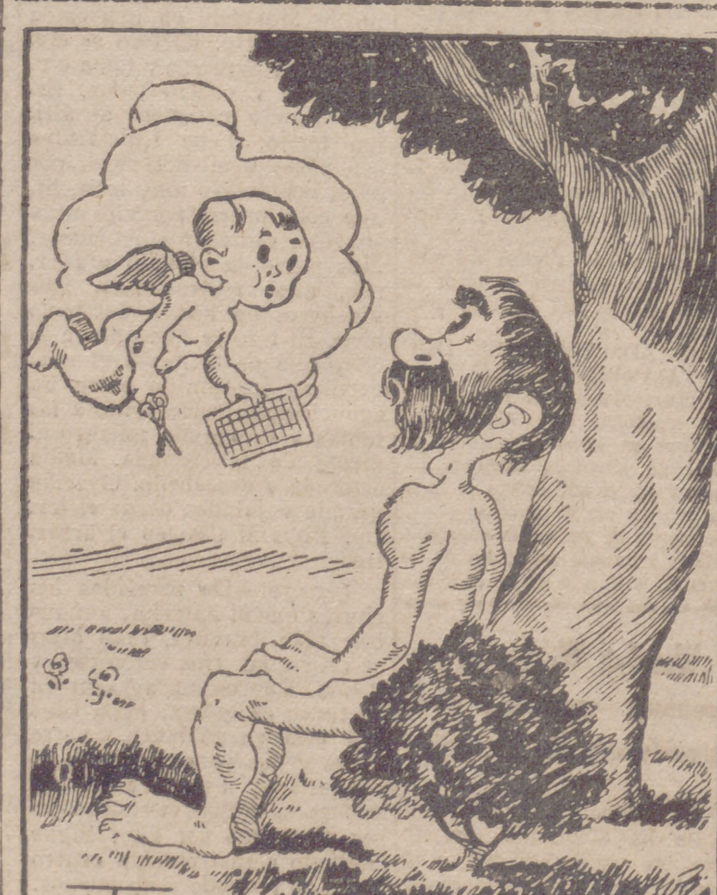
PARADISIACA Por ITU. —Hoy no hay costilla, señor; ha ta el sábado no es día de carne.

En casa, en el café, cuando salimos de paseo, en cualquiera de nuestros ratos de ocio, resulta siempre agradable vez "FOTOS"; pueden ser un recuerdo o "FOTOS" de la semana, pero en todo momento su nombre lo indica: "FOTOS", la gran revista de actualidad,