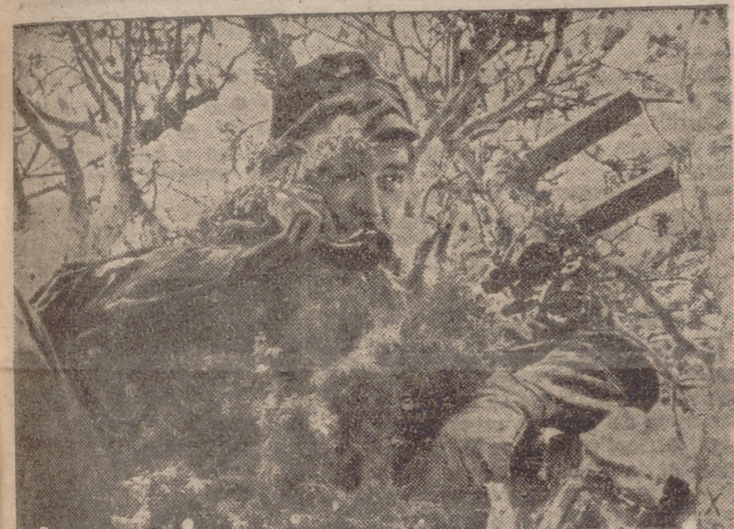
Desde el puesto de observación da este soldado combatiente en Carcila sus datos por el teléfono de la línea de campaña.