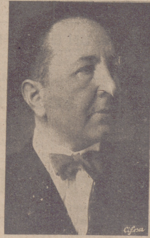
El nuevo embajador de Alemania en España, señor Hans Heinrich Dieckhoff.

Añadió que las conversaciones se desarrollaron en un ambiente de gran comprensión y como resultado "surpasa a las esperanzas de un aumento de material de guerra anglosajón a Turquía para ayudar a perfeccionar sus defensas".—Efe.