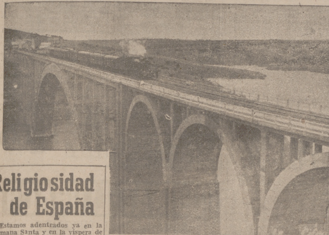
El tren inaugural que conduce a S. E. el Jefe del Estado