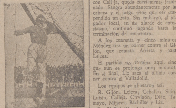
El balón, impulsado por Torquemada, pasó alto.

Fué así: Leicea ha bloqueado un balón que se le escapa al verse acosado por Carolo. El balón lo remata Barriaga.