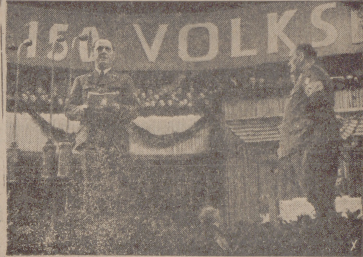
El director ministerial Hans Hinkel pronunciando un discurso durante un concierto popular alemán en el Palacio de los Deportes de la capital alemana.