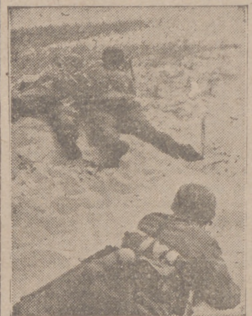
Todavía siguen los duros combates sin interrupción alguna. Soldados alemanes disparando su ametralladora