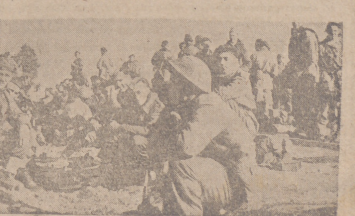
Durante las luchas encarnizadas en el sector de Túnez, los soldados alemanes hicieron prisioneros a gran número de paracaidistas ingleses