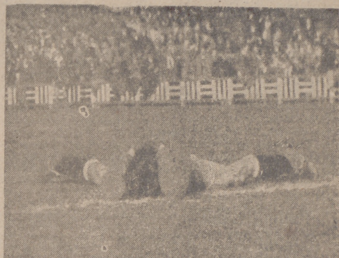
La desesperación del guardameta asturiano, batido por segunda vez.

A los treinta minutos de juego el Valladolid logra el gol del triunfo.