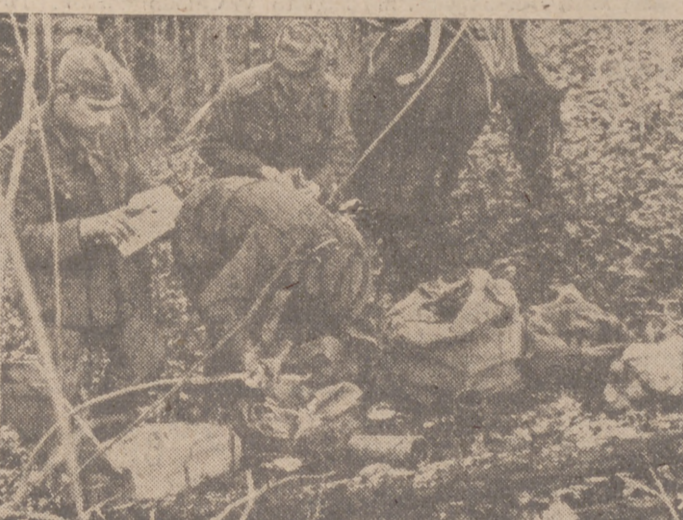
Por medio de estos terrenos rusos transportan los soldados alemanes los viveres y municiones a las primeras líneas en el frente del Este. Aquí se ve a los soldados germanos recogiendo lo que les han traído sus camaradas.