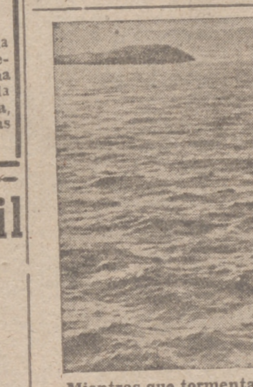
Mientras que tormentas invernales rodean los buques, las unidades alemanas salen de sus bases en el Mar del Norte para emprender nuevos cruceros contra la navegación enemiga.

Shanghai, 16.—Los hindúes residentes en esta ciudad han acordado ayunar el día 3 de marzo para demostrar su solidaridad con Gandhi. Dicho día lo dedicarán a hacer rogativas por la libertad del pueblo de la India.—Efe.