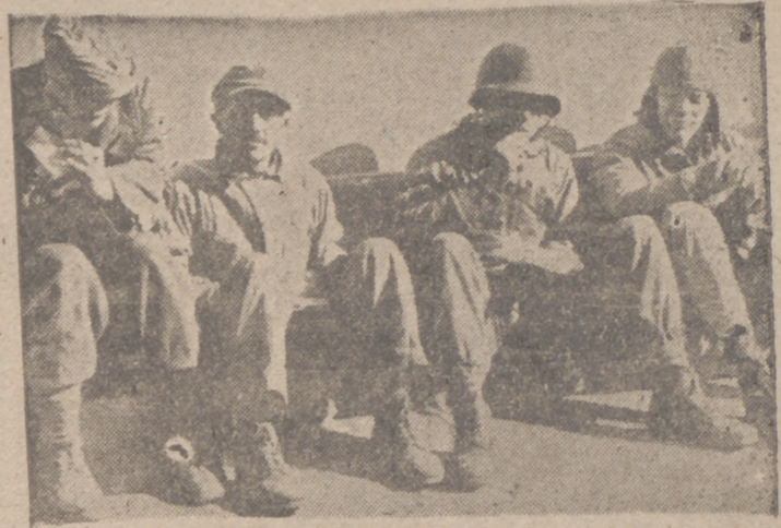
He aquí unos prisioneros americanos capturados por los soldados alemanes.