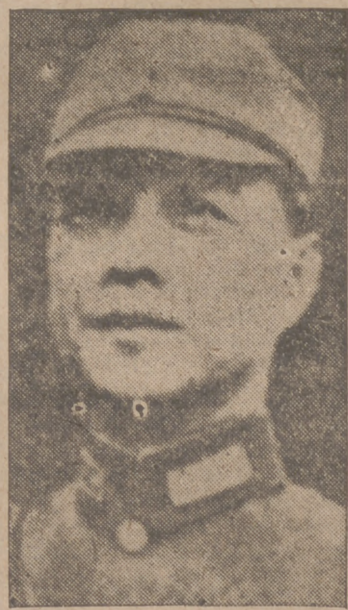
los responsables de estas maniobras. Efe.

Nanking, 28.—El jefe del Estado nacional chino, Wang Ching Wei, se ocupa por primera vez, en un artículo publicado en primera plana por todos los periódicos de Nanking, del problema de abastecimiento del pueblo chino, problema que cada día se hace más urgente. Wang Ching Wei declara que los chinos pueden ser optimistas en lo que concierne a la provisión de arroz, ya que el Japón posee todas las regiones productoras de este cereal en Asia meridional. No obstante, la guerra ha creado dificultades de transporte, y por esta causa se observa una disminución en los abastecimientos de arroz. Todos los países fuertes—añade—tienen una economía dirigida. La China agotada siente la necesidad de hacer otro tanto en interés del mismo pueblo.