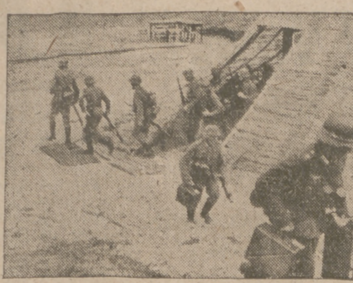
Ha sonado la alarma y los soldados del Reich abandonan la tienda para tomar posiciones.