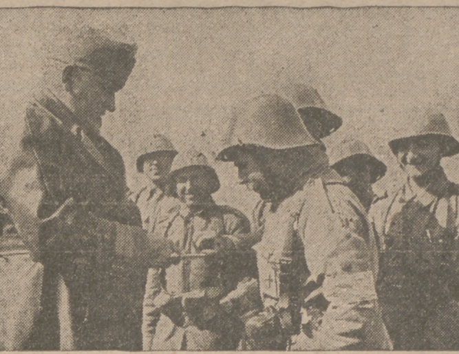
El general Dragalina, comandante de las tropas rumanas, que tan valientemente luchan, junto con los alemanes, contra el bolchevismo, conversando con algunos de sus soldados que se han destacado especialmente.