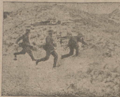
Soldados alemanes ocupan posiciones estratégicas para emplazar sus ametralladoras.