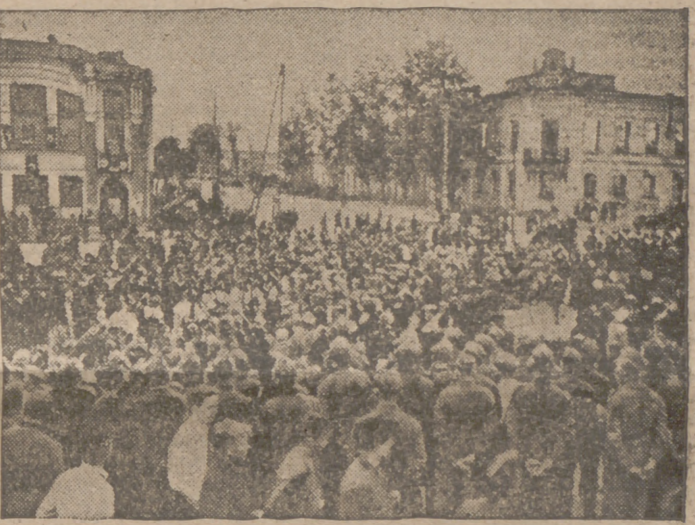
En todas las ciudades del Este tuvieron lugar grandes manifestaciones en las cuales participaron además de los campesinos los artesanos de todas las profesiones.