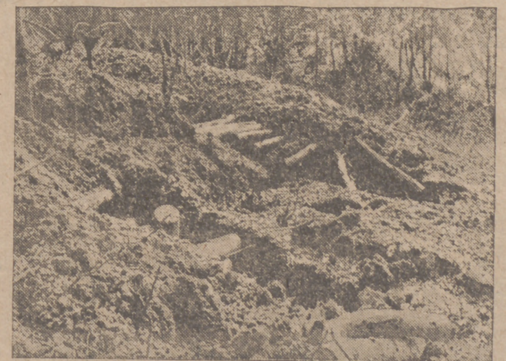
En el sector del Cáucaso, los soviets aprovecharon el favorable terreno montañoso para construir fortificaciones en las cuales resistieron tenazmente contra los ataques alemanes. Después de bombardeos de los "stukas" del Reich y del intenso fuego de la artillería, los soldados alemanes pudieron conquistar el terreno.—Efe.