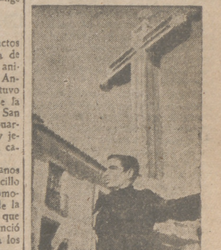
actos y cuando las tareas ordinarias de trabajo y estudio habían concluido, se celebró un magnífico acto en el mismo grandioso marco, iluminado por el resplandor de las antorchas, que le hacía más emotivo.

París, 20.—Sacha Guitry ha adquirido en 87.000 francos una carta de Napoleón firmada el 27 de octubre de 1772 y dirigida a su hermana Elisa. Por otra parte, dos misivas autógrafas dirigidas a Víctor Hugo por Julieta Drouot, han sido vendidas por 45.000 francos y una poesía autógrafa de Víctor Hugo por 11.500. La subasta se realizó en el Hotel Drouot.—Efe.