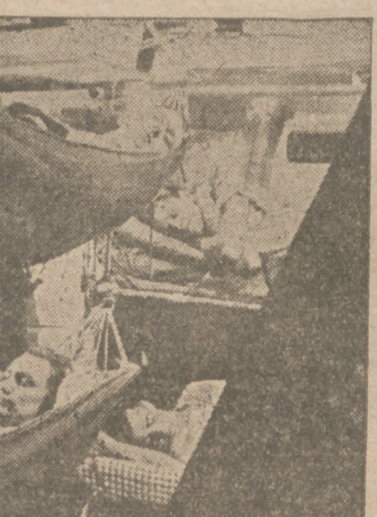
Después de un día de intenso trabajo, duermen estos marinos alemanes excelentemente, tanto en la litera como en las hamacas, hasta su relevo