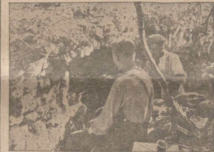
Puesto de mando alemán de infantería en el Cáucaso. Ha sido construido a ras del suelo como medio de defensa ante el fuego enemigo