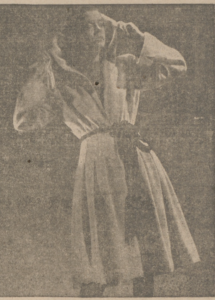
Amplio abrigo blanco de lana con capucha. En el talle se estrecha el abrigo en tablas, pero luego continúa amplio. El abrigo se sujeta con un grueso cordón rojo.

BELLEZA DE LOS BRAZOS. —El brazo femenino debe ser blanco y redondo. Si es flaco se aumentará rápidamente su volumen por medio de una gimnasia o tratamiento especial; si es velludo, habrá que usar un buen depilatorio; si está enrojecido, deberá frotarse con pastas de almendras y miel.