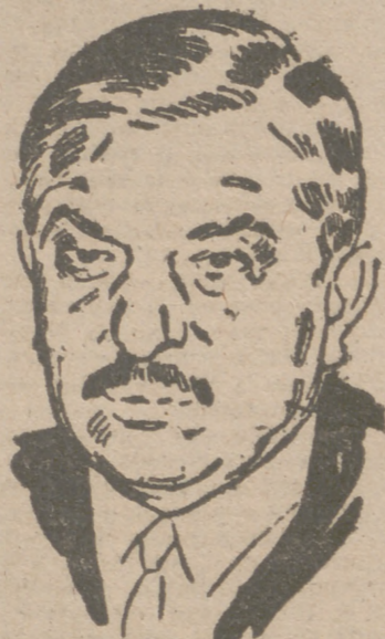
Vichy, 20.—El presidente del Consejo, Laval, ha pronunciado esta noche un discurso por radio, en el que dijo, entre otras cosas:

"Francia no puede ser Francia si no tiene un imperio. Inglaterra y los Estados Unidos nos lo han arrebatado, trozo a trozo, y nuestro país no puede vivir sin él. Franceses: Comprended que no debéis dejaros engañar ni permitir que abusen de vosotros las propagandas extranjeras. Las radios de Londres y Boston no tienen más fin en sus emisiones que extravíar vuestro espíritu y desorientaros, para que sirvais intereses que no son los vuestros."