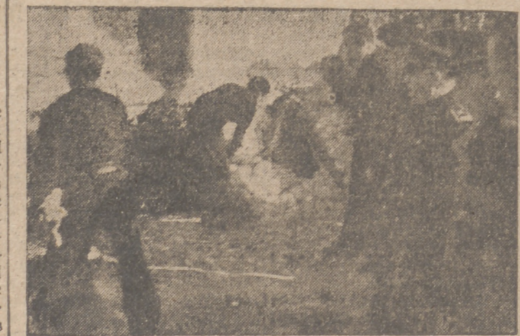
LA OFRENDA DE CORONAS.—Sobre los muros de la Cathedral se colocan las coronas por camaradas del Frente de Juventudes.