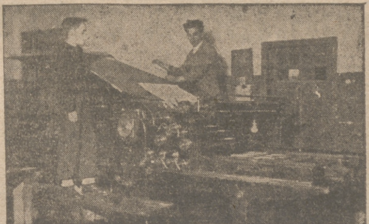
Una de las máquinas planas de los talleres de LIBERTAD, comenzando la tirada de las primeras páginas de CISNE

Al frente de esta Redacción un gran valor de la intelectualidad falangista, que con un claro sentido de su grave misión ha de llevar a esta nueva página de combate del S. E. U. su gran espíritu falangista, juntamente con un criterio de amor