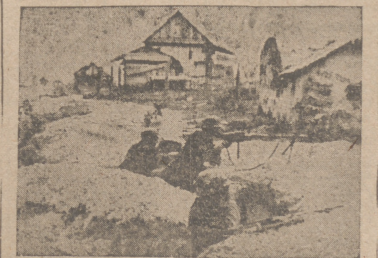
Infantería alemana con ametralladora luchando en las afueras de una ciudad rusa, donde cada casa fue convertida por los soviets en un pequeño fortín y donde resistieron tenazmente pero luego hubieron de entregarse a los alemanes.

Roma, 18.—La Prensa fascista, enteramente movilizada para la victoria final, conmemora hoy el séptimo aniversario de las sanciones contra Italia, sanciones que fueron decretadas por la Sociedad de Naciones el 18 de noviembre de 1935. Los edificios oficiales han sido engalanados, pero el trabajo no ha interrumpido su ritmo en todas las industrias y organismos administrativos. En todas las ciudades de la península las organizaciones juveniles desfilaron ante las placas conmemorativas de las sanciones de la Sociedad de Naciones. En todo el país las mujeres fascistas entregaron donativos a los heridos de guerra hospitalizados y a las familias de los soldados muertos en el frente.—Efe.