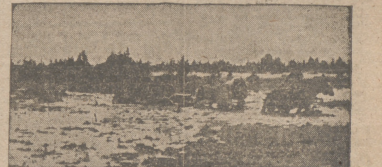
La temporada de las lluvias y por lo tanto del barro y fango ha dado comienzo nuevamente en Rusia. En el Sudeste del lago Ilmen se ha convertido el terreno en un inmenso pantano, dificultando poderosamente el avance a los soldados alemanes. He aquí una "foto" que da cuenta de cómo han de avanzar los caballos tirando de los carros