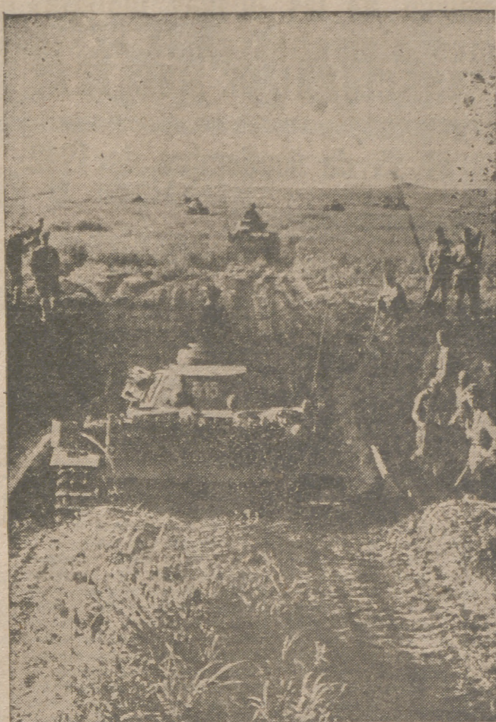
Zapadores alemanes han limpiado un foso de tanques de todas sus minas. Ahora puede seguir el avance alemán contra las líneas rusas.

ESPAÑOL: El Nuevo Estado proyecta y realiza. El Eficace Familiar es suma de eficaces realidades en favor de la familia española. TRABAJADOR! Vigila tu inscripción en el Régimen obligatorio de Subsidios Familiares.