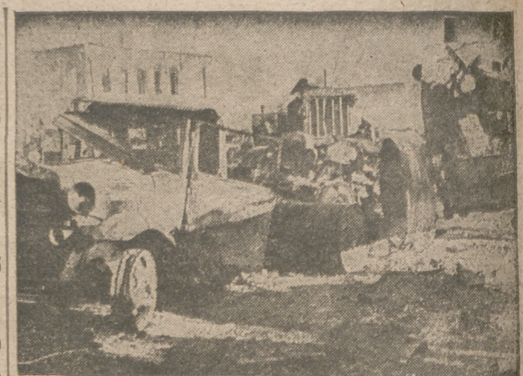
Las carreteras a lo largo del Don están barricadas completamente por vehículos soviéticos destruidos por el fuego de las baterías alemanas.

Nankin, 4.—La rectificación de la línea del frente japonés en la provincia de Chekiang, iniciada el 19 de agosto, ha terminado, según anuncia el comunicado semanal de la Oficina de Prensa del Ejército nipón. Añade que las tropas japonesas que operan en la séptima zona de guerra, en la provincia de Kuangtung, se han retirado a sus puntos de partida, después de haber termi-