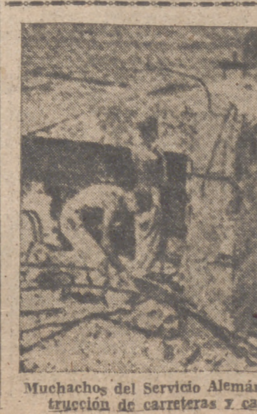
Muchachos del Servicio Alemán de Trabajo ayudan a la construcción de carreteras y caminos en el frente del Este

Oviedo, 4.—Todos los preparativos que han de dar el realce que corresponde a la grandiosidad de las fiestas que han de celebrarse son de volumen fantástico. La calle de Uría ofrece un precioso golpe de vista, y en las columnas y postes de la capital se han colocado escudos de los partidos judiciales y Ayuntamientos que han anunciado su asistencia a los actos de consagración de la Cámara Santa y conmemoración de los Reyes Caudillos. También se levantan artísticos arcos de triunfo en las entradas de Castilla y Galicia, por donde han de pasar las personalidades que en los próximos días llegarán a Oviedo. Las tribunas y altares que se levantan en la calle de Uría y Paseo de José Antonio están ya terminadas; como así también los arcos de triunfo montados en las calles de San Lázaro y Toledo, donde también han sido colocadas banderas dedicatorias. En la Catedral se han colocado cortinas a todo lo largo del andamio. Oviedo ofrece un fantástico aspecto y por sus calles rebosa la animación. La Delegación Provincial de Educación Popular ha instalado un perfecto servicio de altavoces.—Cifra. MULTAS DE LA FISCALIA DE TASAS EN CUENCA