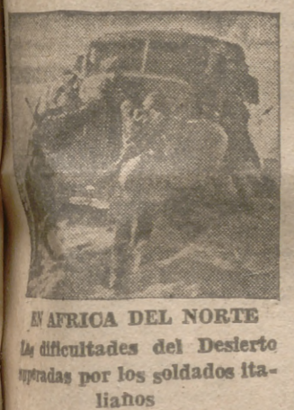
En AFRICA DEL NORTE las dificultades del Desierto sufridas por los soldados italianos

portar al colaborar con su sustituto. Lo mismo que vine aquí o b e d e c i e n d o una consigna del Caudillo, cese en el cargo y estoy dispuesto a seguir trabajando con igual espíritu con que lo hice en los puestos o destinos que por voluntad de aquél o por mi carrera haya de desempeñar en lo sucesivo. A continuación hizo uso de la palabra el nuevo titular, camarada Blas Pérez, que pronunció el siguiente discurso: Discurso del camarada BLAS PEREZ Madrid, 4.—Pocas palabras he de pronunciar en este acto, mal se compagina con el temperamento (Pasa a la tercera página.)