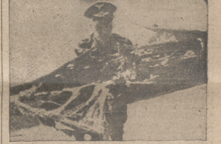
A pesar de haber recibido un impacto en un ala, este avión alemán del tipo "FW-189", logró llegar nuevamente a su base después de haber efectuado un vuelo de reconocimiento

En la frontera de Irlanda reina gran actividad Belfast, 4.—Un importante contingente de Policía ha sido enviado con urgencia a Randalstown, lugar donde la pasada noche ha hecho explosión una bomba que cortó las comunicaciones telefónicas con Antrim. Durante la noche, la represión contra los miembros del Ejército republicano irlandés ha continuado, siendo detenidas sesenta y siete personas acusadas de intentar atacar a mano armada a los miembros de las fuerzas militares anglo-norteamericanas del Ulster. Se sabe que, por otra parte, unas cien personas han sido interrogadas y sus domicilios registrados. Fuera de Belfast han sido sometidas a interrogatorio policíaco unas doscientas personas. A todo lo largo de la frontera con Irlanda reina gran actividad, y se sabe que algunas de las personas detenidas lo han sido por tenencia ilícita de armas. Algunos de los inculcados han huido de sus domicilios y la Policía los busca activamente.—Efe.