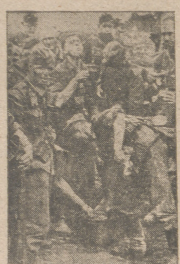
Aprovechando un momento de descanso, estos soldados alemanes refrescan del fuerte calor que reina en el frente Sur de Rusia, donde tiene lugar la actual ofensiva.

Comenzaron en Madrid los cursos para maestras