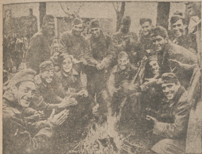
En los frentes rusos nuestros camaradas sonríen después de realizar actos heroicos. Hoy, en España, reciben el homenaje entusiasta de todo un pueblo que les aclama

Anteayer entraron en España mil trescientos voluntarios de la División Azul mayores de treinta y cinco años, casados con hijos y los que fueron heridos de gravedad. Llegaron a Hendaya los dos trenes a las diez menos cuarto de la mañana del domingo. A las once y treinta y cinco estaban los voluntarios en Irún, donde permanecieron hasta la una y veinticinco. Hacia las dos de la tarde llegaron a San Sebastián, y después siguieron en dirección a Madrid, a donde llegaron en la mañana de ayer.