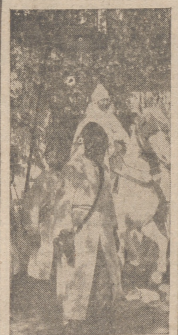
S. A. J. el Jalifa sale de su Palacio de Tetuán para dirigirse a la Mesi-la.—Foto Cifra.

Los Angeles, 25.—En gran parte del Sur de California se ha registrado una alarma aérea de 40 minutos de duración en la noche del domingo. La alarma fué dada a las 20,54 horas y terminó a las 21,42. En las localidades afectadas fueron apagadas todas las luces.—Efe.