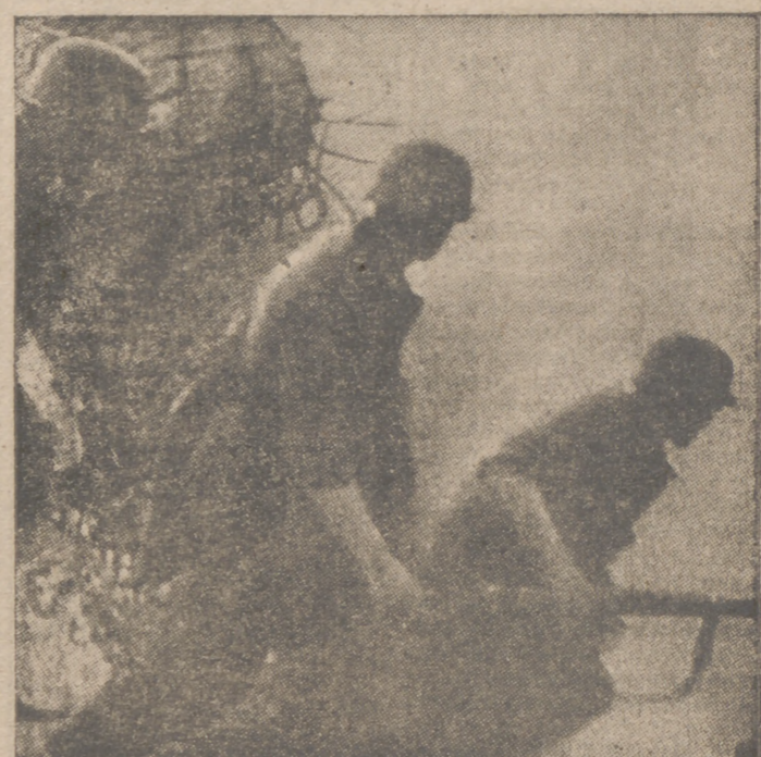
Nuestros voluntarios de la División Azul, hechos al riesgo, asaltan una posición enemiga

Momentos antes de esta hora, en el andén número 1 se encontraban