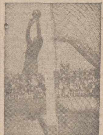
LIBERTAD ofrece en otro lugar de este número amplia información de su redactor "Luis Angel" sobre el gran encuentro en Valladolid-Atletico Aviación

El paso triunfal de los voluntarios por las tierras españolas constituye una prueba magnífica de ese reconocimiento. España está satisfecha de la juventud que ha conquistado para ella respeto y admiración.