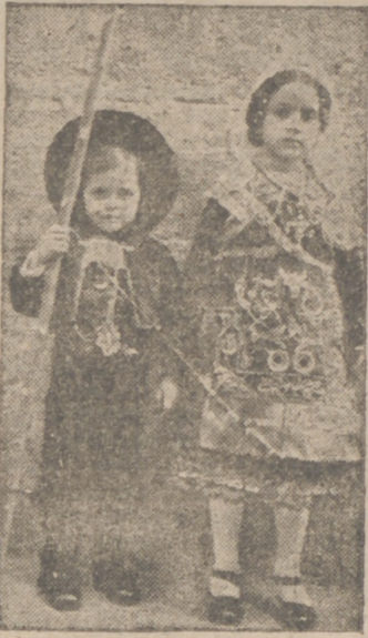
Una encantadora pareja infantil de baile vistiendo el típico y vistoso traje charro, que actuó el domingo en Calderón durante el Concurso de cantos y danzas de la Sección Femenina

Destacaron por su vistosidad y riqueza los trajes típicos charros, y