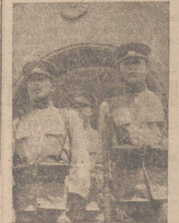
Tropas japonesas durante una revista militar.