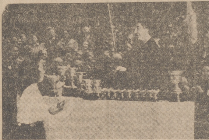
Madrid, 26.— Mañana de hoy han comenzado celebrándose las pruebas de los primeros juegos universitarios nacionales en los terrenos de la Ciudad Universitaria.

A las pruebas finales asistieron el ministro de Educación Nacional, el general Moscardó y Pilar Primo de Rivera