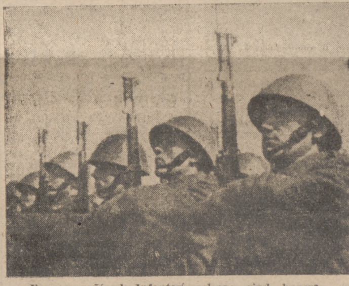
Una compañía de Infantería eslovaca rinde honores

Y todo esto es lo que se podría conseguir a través de esta forma de política. Que no se diga que carecemos de elementos financieros. Las posibilidades reales deben ser el único límite a nuestra acción. El mecanismo financiero es la accidentalidad y debe estar en todo momento al servicio de la política. Para la realización de una política de este género es imprescindible la creación de un órgano que tenga a su cargo la coordinación de la vida económica toda. Ya anteriormente se constituyó a estos fines el Consejo de Economía Nacional, que si hasta el momento ha podido bastar, estimamos que al afrontarse la ejecución y articulación de amplios planes, por su nuevo carácter asesor habrá de resultar insuficiente.