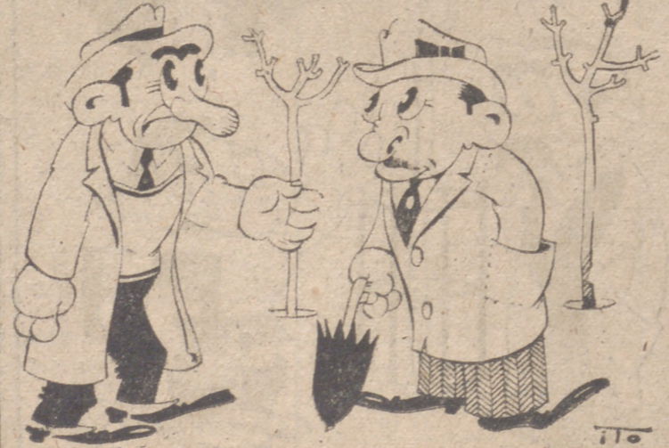
Fútbol internacional Por ITO —Debo haber sido un partido agotador para los franceses. —¿Por qué lo dice usted? —Porque acabaron en un "quatre".

SEÑORA, mientras su sirviente asista a la Escuela de Formación de la Sección Femenina, usted sabrá mensualmente la calificación que recibe por su comportamiento y aplicación.