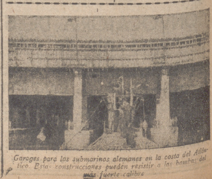
Garages para los submarinos alemanes en la costa del Asturico. Estas construcciones pueden resistir a las bombas de más fuerte calibre.