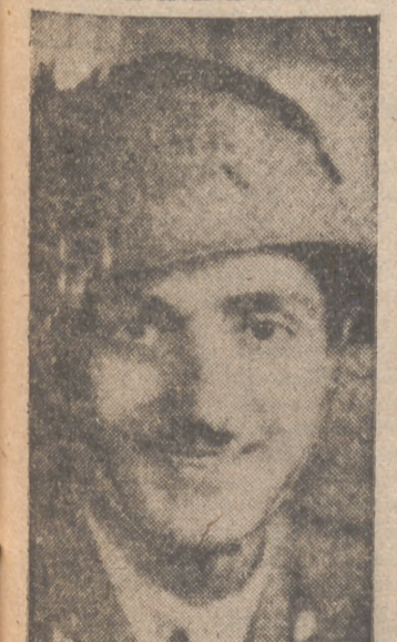
El oficial italiano Oreste Toscano, condecorado con la Medalla de Oro

Lisboa, 16.—El vapor británico "Dago" fué bombardeado y hundido por la aviación alemana frente a la costa portuguesa. Treinta y siete supervivientes han desembarcado en la costa de Portugal, a donde se trasladaron en unas balsas. Cuatro de ellos se encuentran heridos y han sido trasladados a un hospital. Además pudo observarse desde la costa que una corbeta inglesa era asimismo atacada por aviones alemanes, pero se cree que pudo salir indemne del bombardeo.—Etc.