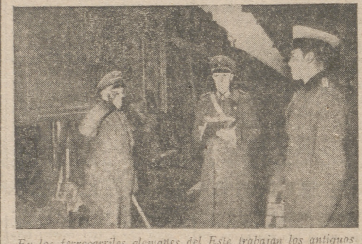
En los ferrocarriles alemanes del Este trabajan los antiguos ferroviarios polacos a entera satisfacción de sus nuevos jefes