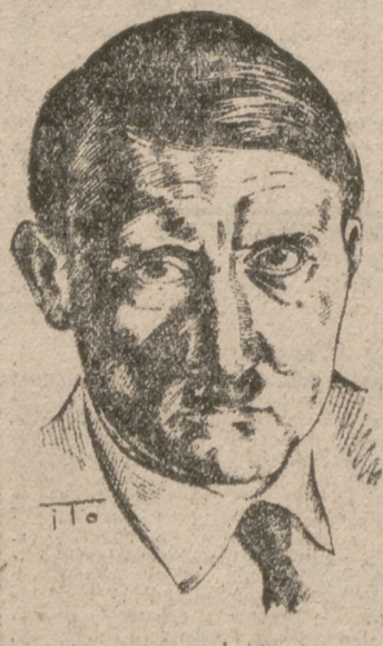
(Pasa a la última página).

adversarios. Estos, en su ciega enemiga, no se daban cuenta de que la miseria de Alemania no significaba la prosperidad propia; y así los Estados cuya dirección había sido presa del azote judío-capitalista poco tardaron en alcanzar, y hasta en sobrepasar, el número de parados que tenía Alemania, a pesar de sus enormes riquezas tanto de productos como de oro. Como consecuencia de los ánimos así preparados, asistimos hoy al trágico espectáculo de que las actuaciones de los pueblos engañados y derrotados no se dirijan contra los autores y los culpables de la guerra, como tales, sino como responsables de la insuficiente preparación de la misma. Esta extraña o incomprensible mentalidad explica has-