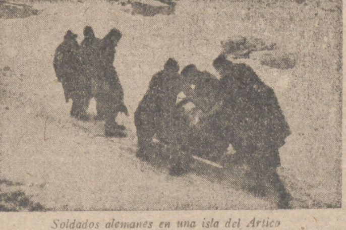
Soldados alemanes en una isla del Ártico