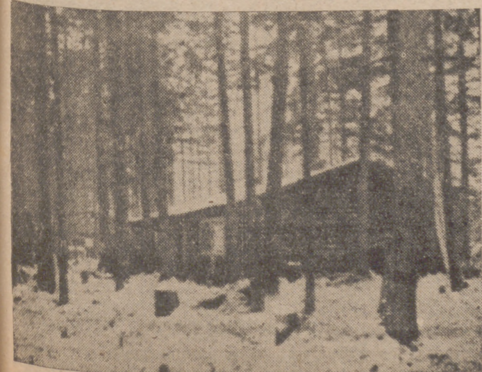
Un campamento invernal alemán en el bosque, hecho de troncos, en el frente de San Petersburgo

El subsidio de Vejez te garantiza una pensión cuando por el peso de los años y del trabajo no puedas ganar un jornal.—Infórmate en las oficinas del Instituto Nacional de Previsión.