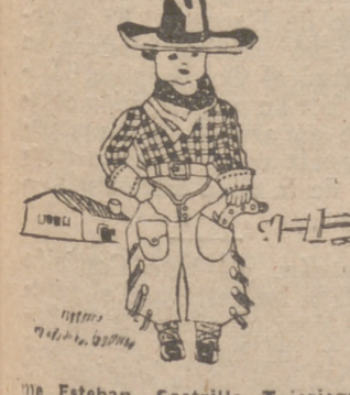
—Este Esteban, 7 años. Valladolid.