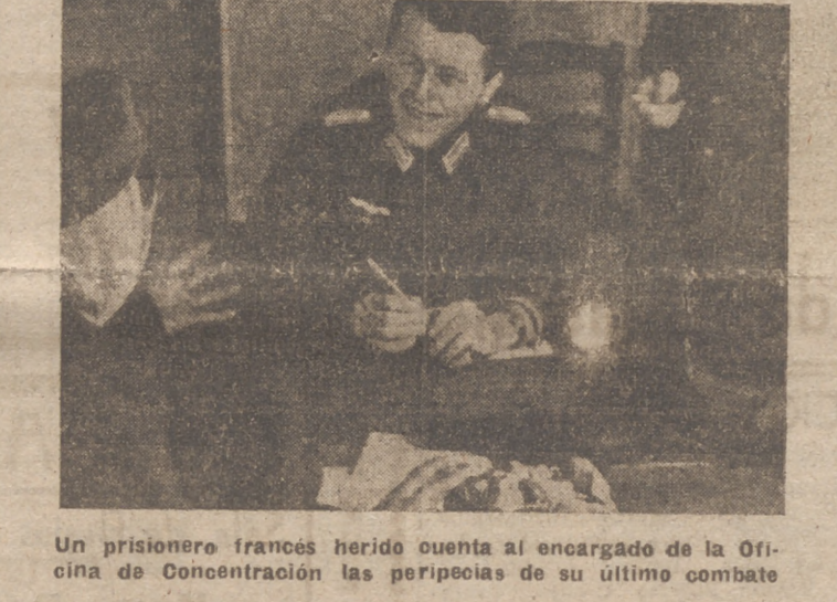
Un prisionero francés herido cuenta al encargado de la Oficina de Concentración las peripecias de su último combate