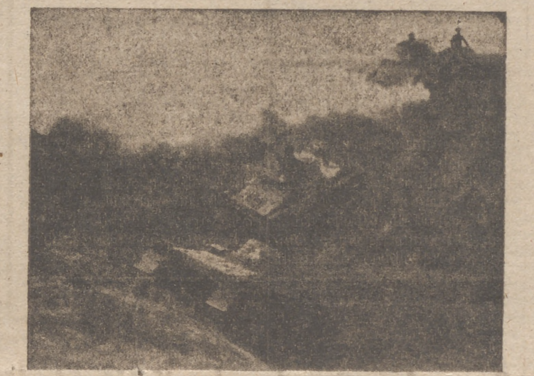
Tanques alemanes avanzando en uno de los frentes del Oeste

También fueron descubiertos el domicilio del inculpado un paracaídas, 20.000 dólares americanos, un casco de guerra, varias medallas alemanas, una insignia de la aviación militar del Reich y numerosas informaciones sobre puentes y carreteras de Irlanda, así como de la disposición de las fuerzas de defensa. Oficialmente se juzga el caso de extrema gravedad.—Efe.