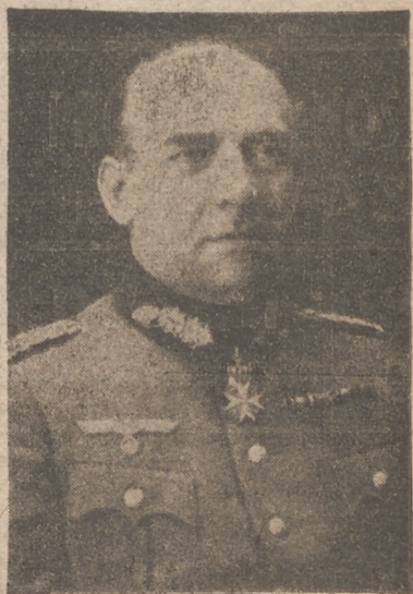
El general alemán Von Falkenhorst

Todas las divisiones belgas que luchan sobre suelo nacional se mantienen en la línea del Esca- lda. El príncipe Carlos, heric- mano del Rey, se encuentra en el ejército que lucha en terric- nio belga...”