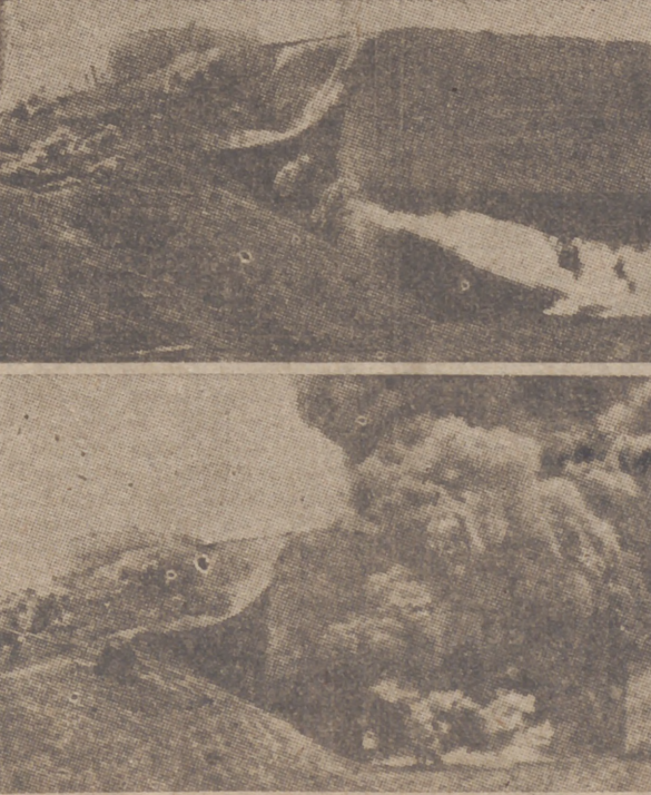
Para tomar el fuerte de Eben Emael los alemanes han empleado potentísimos lanzallamas, que producen una temperatura de 2.000 grados

París, 25.—El presidente del Consejo y ministro de Defensa Nacional, Reynaud, se ha entrevistado