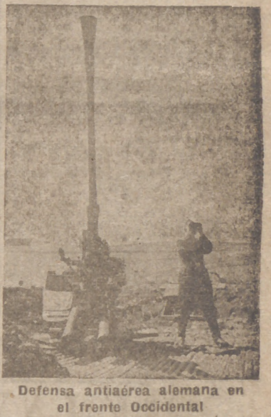
Defensa antiaérea alemana en el frente Occidental

En la Exposición figuran varias obras de Gian Domenico de Marchis realizadas en España, entre ellas bustos, en bronce, del Caudillo y de su esposa; de Carmencita Franco, en mármol, del señor Serrano Suñer, también en mármol; un grupo, en bronce, con los cuatro hijos mayores del ministro de la Gobernación y varios esbozos y bocetos. Todas las obras fueron muy celebradas.—Cifra.