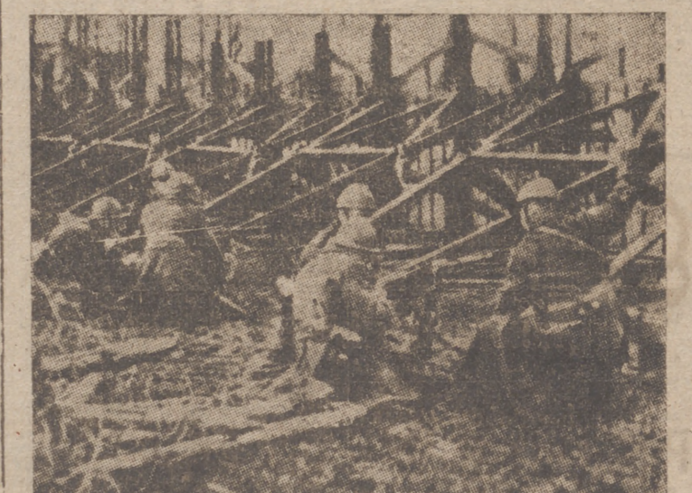
Los belgas refuerzan precipitadamente sus últimas líneas de resistencia. Para hacer frente a los ataques en masa de los carros de asalto ale- manes, los soldados del Rey Leopoldo levantan verdaderas murallas de acero