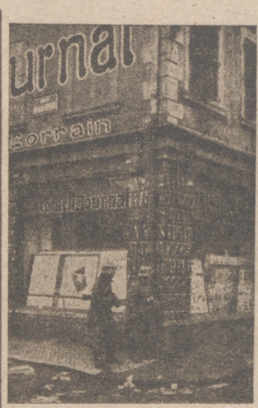
Patrulla alemana en una ciudad francesa recién ocupada

bombas de gran peso, recibió otras tres más tarde en la popa. A consecuencia del ataque quedó inmobilizado y dejó de funcionar su artillería antiaérea.—Efe.