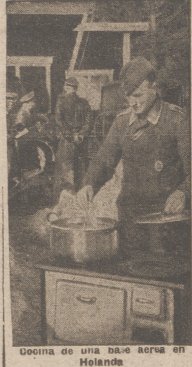
Cocina de una base aérea en Holanda

En el nuevo Gobierno forman parte 29 conservadores, 11 laboristas, cuatro liberales de Simon, tres liberales de la oposición, un nacional laborista y siete representantes nacionales. Otro nuevo cargo creado es el de secretario parlamentario del Ministerio de producción aero-