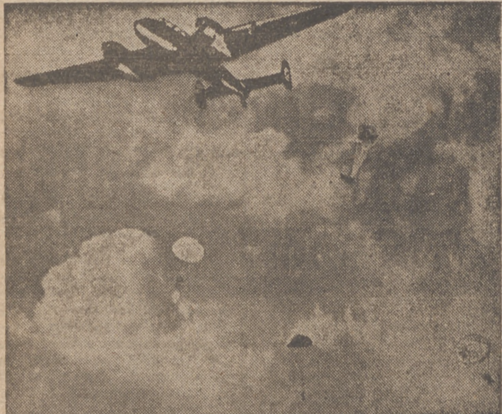
La actuación de los paracaidistas alemanes constituye la novedad más sensacional registrada hasta ahora en la imponente contienda europea que tiene estos días por escenario las tierras de Bélgica y Holanda. He aquí el momento en que un avión alemán deja caer sobre territorio belga un grupo de paracaidistas.

TRES DE ELLOS, A ORILLAS DEL MOSA, Y EL CUARTO, AMENAZANDO A SAINT TRUND