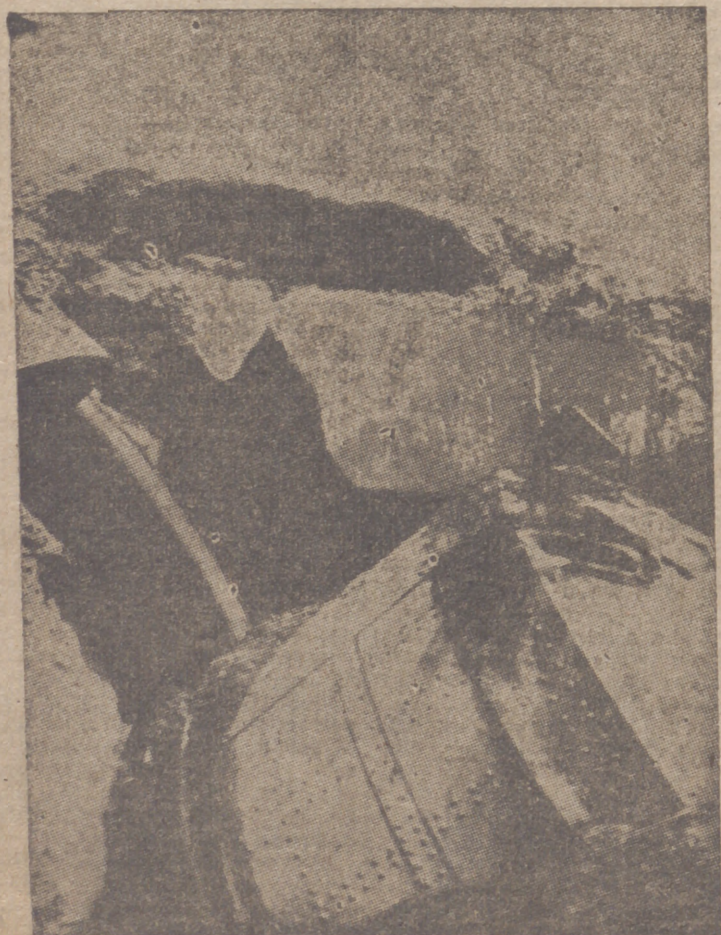
Una cúpula de los famosos fuertes de Lieja que en agosto de 1914 cayeron en manos de los alemanes.—En la fotografía se puede comprobar el efecto de la artillería de grueso calibre.