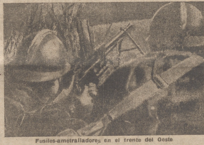
Fusiles-antiaéreos en el frente del Oeste

La mayoría de los paracaidistas que la noche última aterrizaron en Holanda han sido capturados.—Efe.