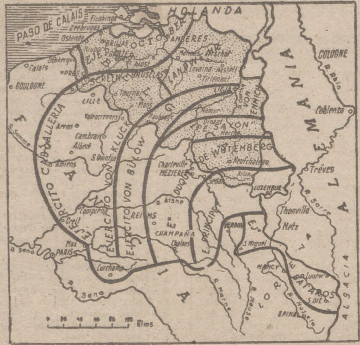
Gráfico de la ocupación de Bélgica por los alemanes en 1914. Señalamos aquí el avance germano hasta la batalla del Marne.

Tan pronto como Amberes quedó aislado, los dos ejércitos concentrados en Lieja fueron lanzados al Oc-