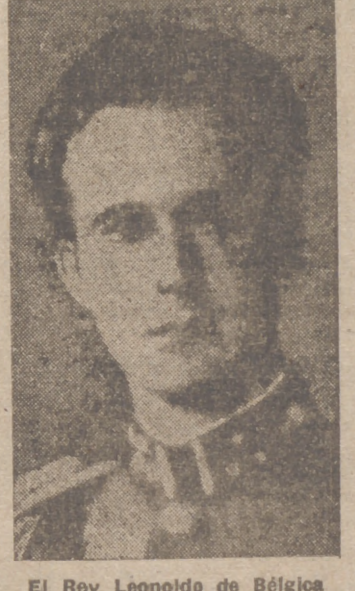
El Rey Leopoldo de Bélgica

El Gobierno proseguirá en el interior la política comenzada y adoptará diversas medidas de carácter económico, necesarias en las circunstancias actuales.—Efe.