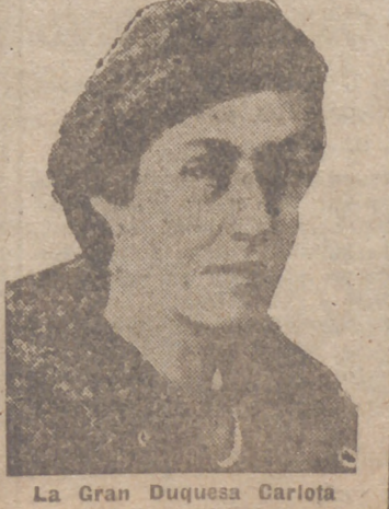
La Gran Duquesa Carlota de Luxemburgo

Forman parte de ellos representantes DE TODOS LOS PARTIDOS