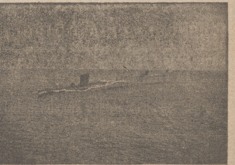
Submarinos alemanes en el mar del Norte

«Apelo a los nobles sentimientos que siempre han animado a la Casa de Saboya con el fin de invocar la alta autoridad de vuestra Majestad en lo que se refiere al conflicto en que