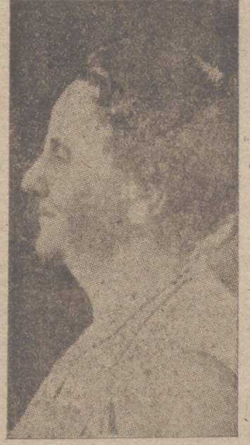
La Reina Guillermina de Holanda