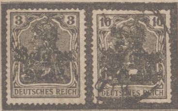
Sellos puestos en circulación por los alemanes para ocupar Bélgica. Sobre sellos alemanes se puede leer la sobrecarga «Belgien» y «3 centesimos» y «10 centimes» en otro.

El día 23 el grueso de sus tropas, moviéndose hacia el S. O., destruyeron a las fuerzas expedicionarias inglesas en Mons, y al día siguiente podía llegar a Tournay. Este fulminante movimiento hizo repliegarse a franceses e ingleses al ver amenazado