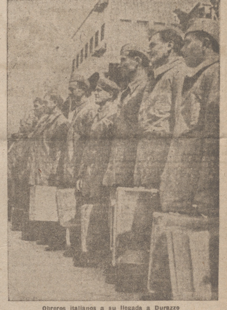
Obreros italianos a su llegada a Durazzo

Valencia, 4.—Los pescadores de Gandia y Denia se han visto sorprendidos con una abundante pesca e inesperada de bancos de sardinas que les ha proporcionado una tan gran cosecha como pocas veces habían conocido. Los que pescan con las artes del "botu" obtienen muy buenos rendimientos en las zonas mencionadas, lo que les permite grandes ganancias y sueldos muy crecidos a todo el personal que interviene en estas operaciones de pesca.—Cifra.