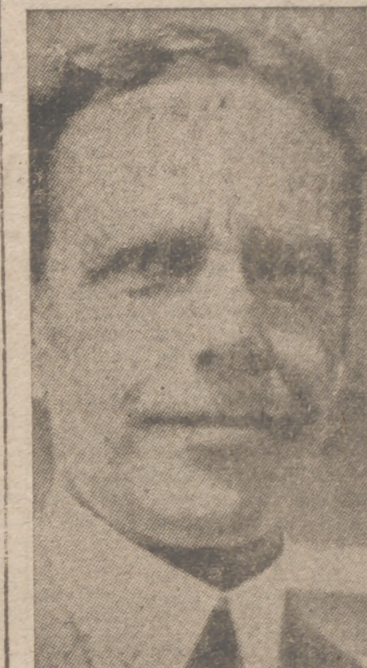
M. WILLIAM PHILLIPS, embajador de Estados Unidos en Roma, que recientemente ha celebrado una entrevista con el conde Ciano con motivo de la cuestión del Mediterráneo