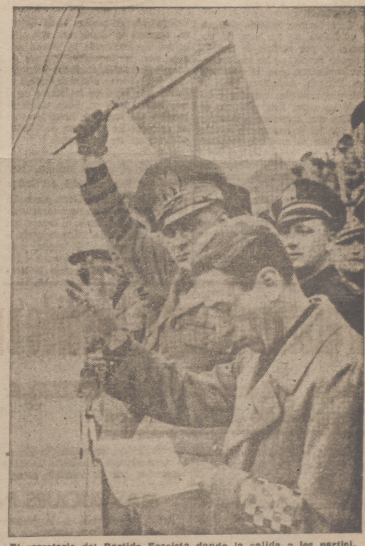
El secretario del Partido Fascista dando la salida a los participantes en la carrera ciclista «Mille Miglia», en Roma