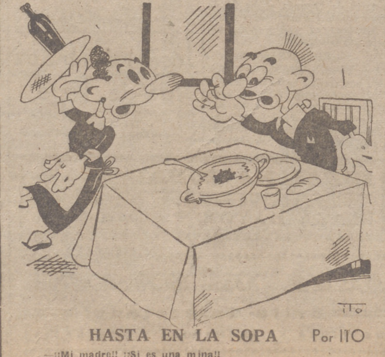
HASTA EN LA SOPA Por ITO