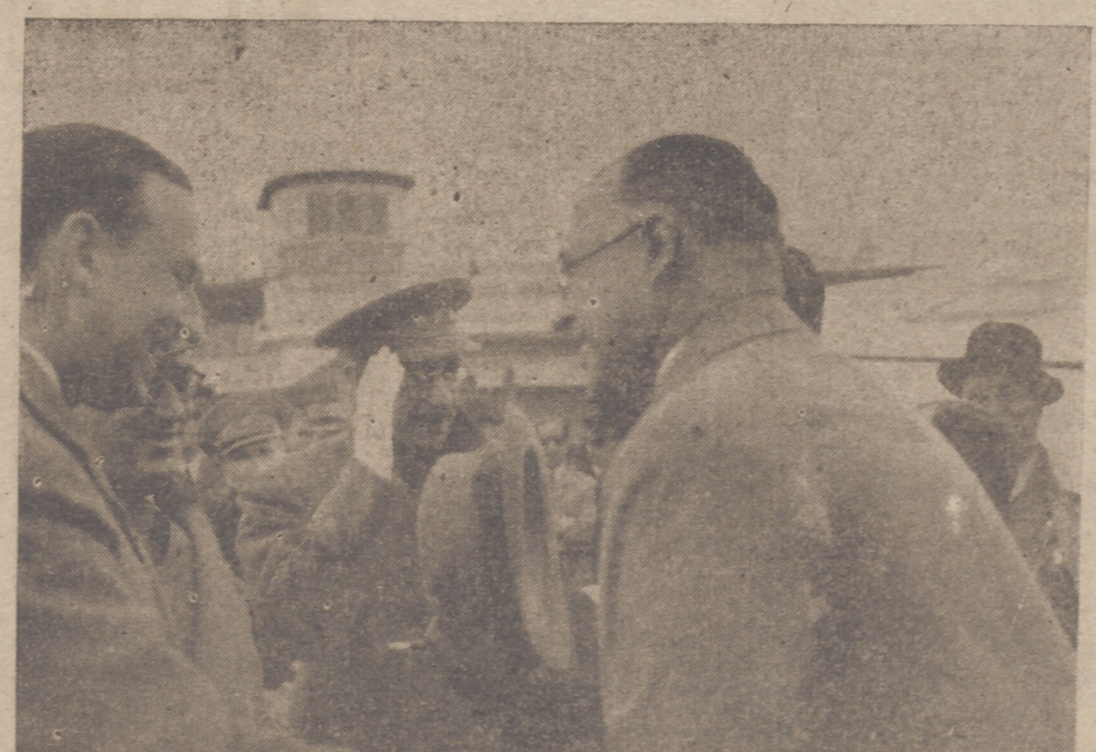
Las personalidades portuguesas llegadas en el avión que inauguró la nueva línea Lisboa-Madrid-Barcelona son recibidas por el embajador de Portugal en Madrid y los ministros del Aire y Relaciones Exteriores