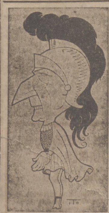
El popular actor ENRIQUE RAMBAL en "Fabiola" (Caricatura por ITO)