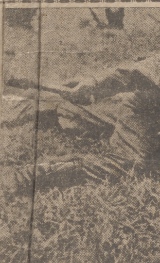
Un soldado alemán avanza, cuerpo en tierra, hacia la línea enemiga, con la bayoneta en una mano y en la otra la bomba de mano dispuesta a ser lanzada