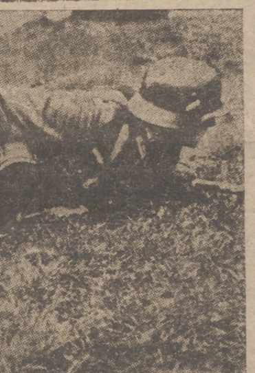
Un soldado alemán avanza, cuerpo en tierra, hacia la línea enemiga, con la bayoneta en una mano y en la otra la bomba de mano dispuesta a ser lanzada

España y Portugal venían padeciendo, desde fines del siglo XVIII, el mimetismo degradante que en toda la escala biológica caracterizó siempre a los seres más débiles, y no los preservó casi nunca de la definitiva destrucción. Sobre vino, sin embargo, hace ya tiempo la reac-