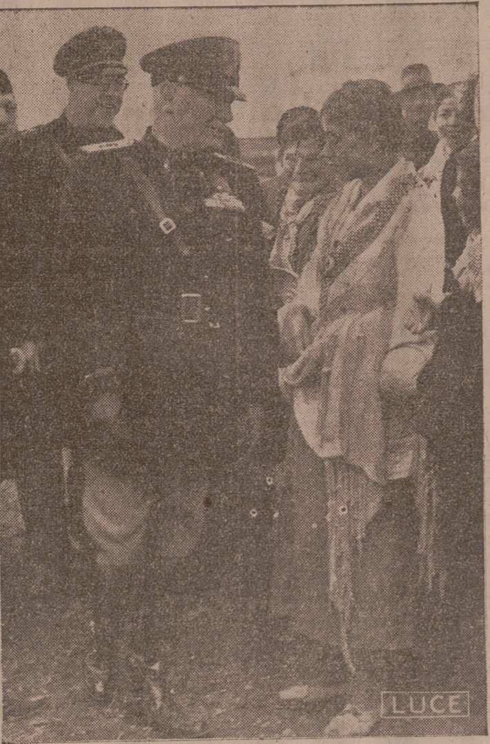
Pomezia.—Inauguración del nuevo pueblo de Pomezia. El Duce habla con los colonos, informándose de sus condiciones

Munich, 16.—Esta mañana se ha verificado el entierro de la octava víctima del atentado del día 8. El cortejo fué presidido por las autoridades y jefes del Partido, y figuraban también en él nutridas representaciones de las Armas del ejército.