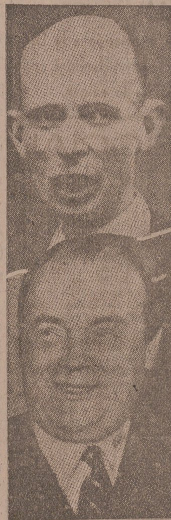
M. Van Kléffens, ministro de Relaciones Exteriores de Holanda, arriba; y M. Spaak, ministro belga del Exterior, abajo