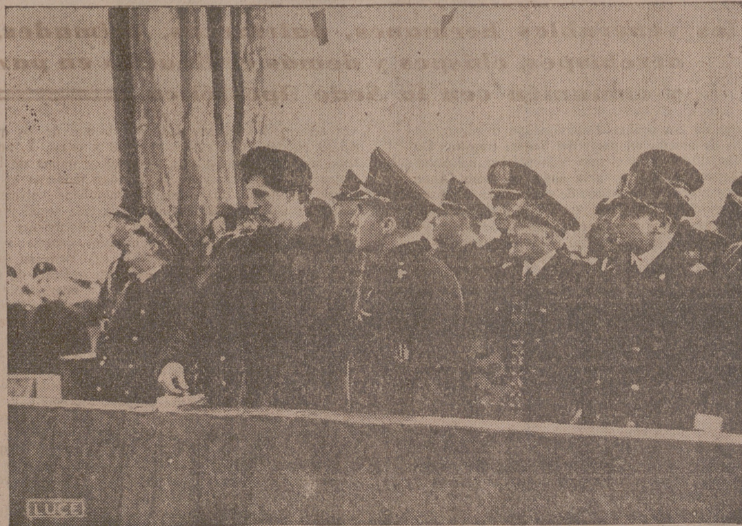
GENOVA.—La ceremonia del bautizo de la nave «Imperio». Madrina S. A. R. la duquesa de Spoleto