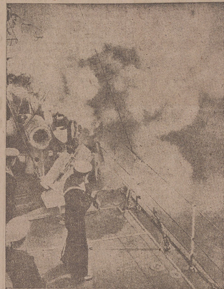
Un barco inglés lanza bombas de profundidad contra un submarino en sumersión

Así lo dispongo por el presente decreto, dado en Madrid a 15 de noviembre de 1939.—AÑO DE LA VICTORIA.—FRANCISCO FRANCO.—Cifra.