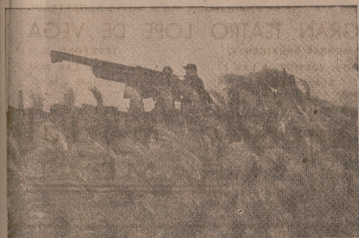
Un cañón francés de costa

Londres, 16.—Según una nota publicada por el ministro de la Guerra Económica de la Gran Bretaña durante la semana que ha terminado el 11 del actual llegaron a puertos británicos, debidamente requisados provisionalmente para impedir el contrabando marítimo, 108 embarcaciones, a las que se suman las 86 de la semana anterior y que todavía continúan controladas.