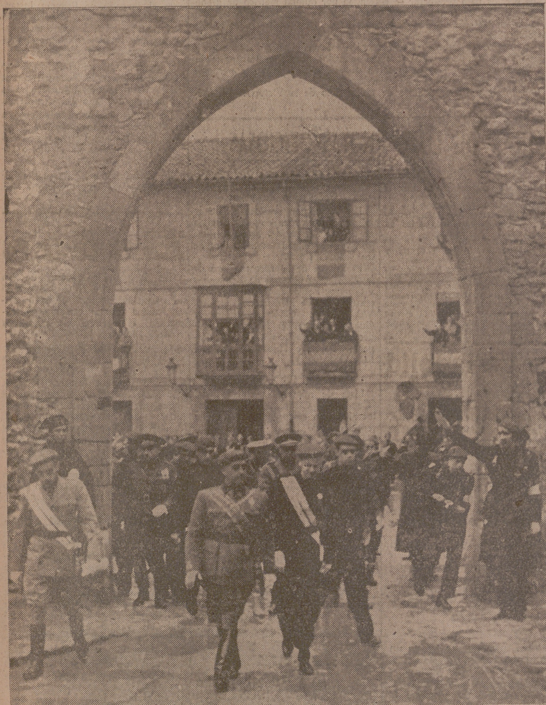
El Caudillo, rodeado de su Gobierno, llega al Monasterio de las Huelgas para asistir a la jura del Consejo Nacional de F. E. T. y de las J. O. N. S.

Madrid, 27.—A última hora de esta tarde ha pasado con dirección a Toledo Su Excelencia el jefe del Estado, Generalísimo Franco, acompañado del general Moscardó.