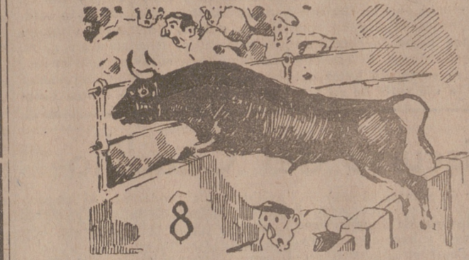
El quinto toro, de Villarreal, dando un susto a los del 8 (Apunte por ITO)